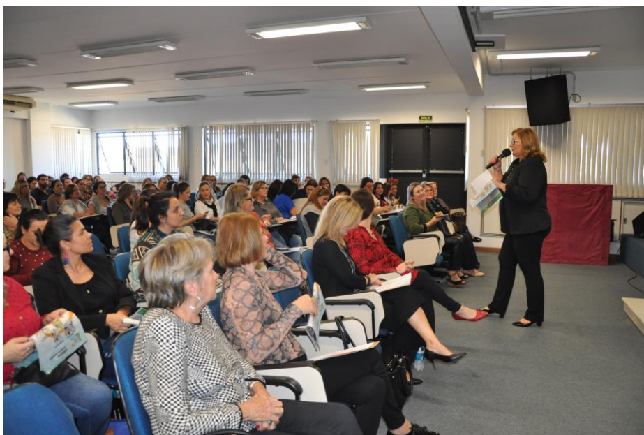
Professores participantes do 1º Encontro

O primeiro encontro de 2019 do Projeto LER..., promovido pelo Grupo Sinos em parceria com as Faculdades Integradas de Taquara (Faccat) e Universidade Unisinos, ocorreu na sexta-feira, dia 19 de maio, no auditório prédio administrativo da Faccat. O encontro reuniu professores de escolas da região, que receberam o primeiro fascículo do ano, enfocando o tema “Como pensam os cientistas?”.