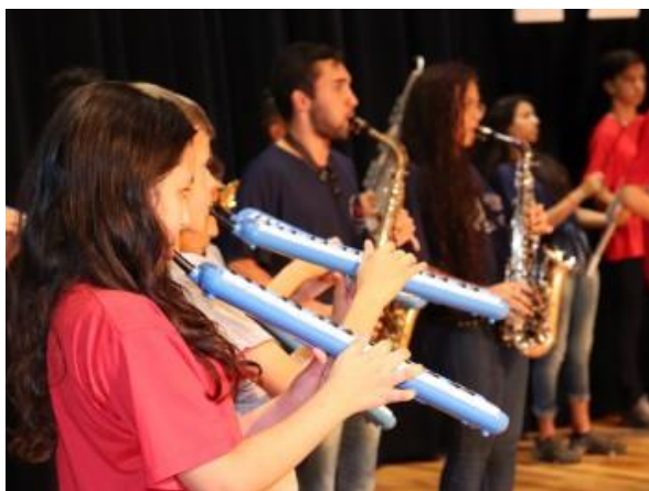
Evento de encerramento 2019 do Projeto LER...-Literatura e Ciência.