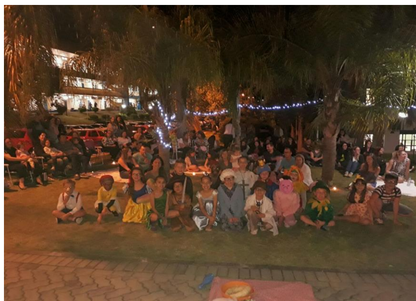
Participantes do 1º Luau Literário de Letras