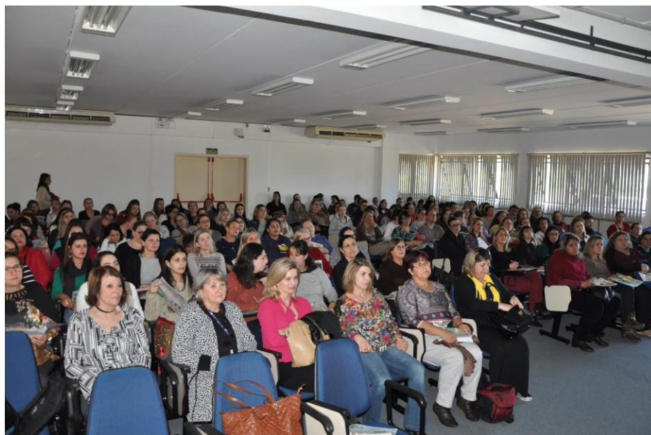
Professores participantes do 2º Encontro, no auditório, no primeiro momento