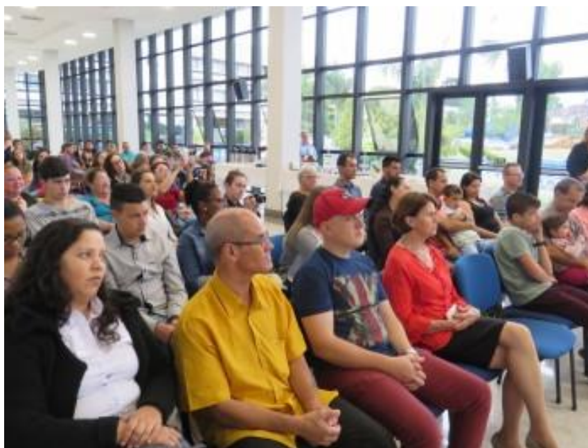
Familiares e amigos dos acadêmicos-autores no lançamento do livro