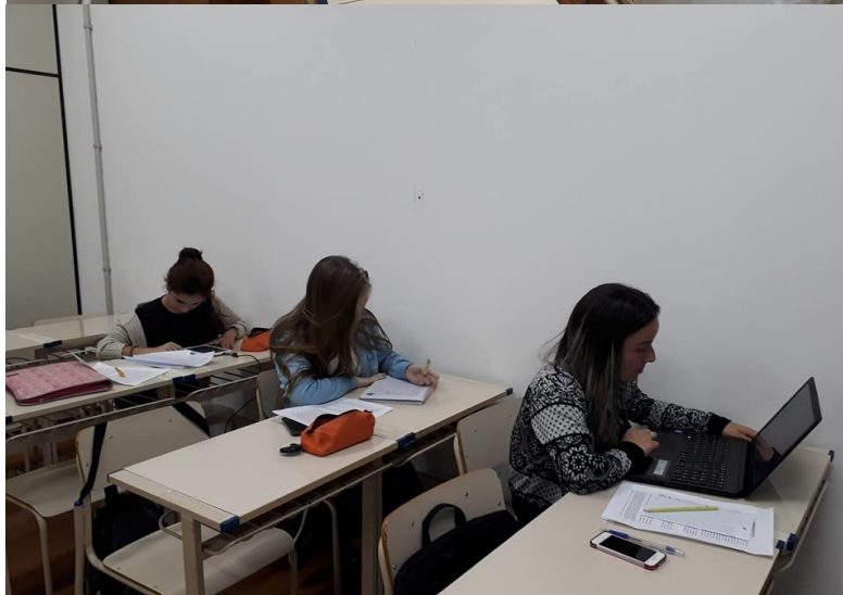
Alguns dos alunos que receberam atendimento em 2017