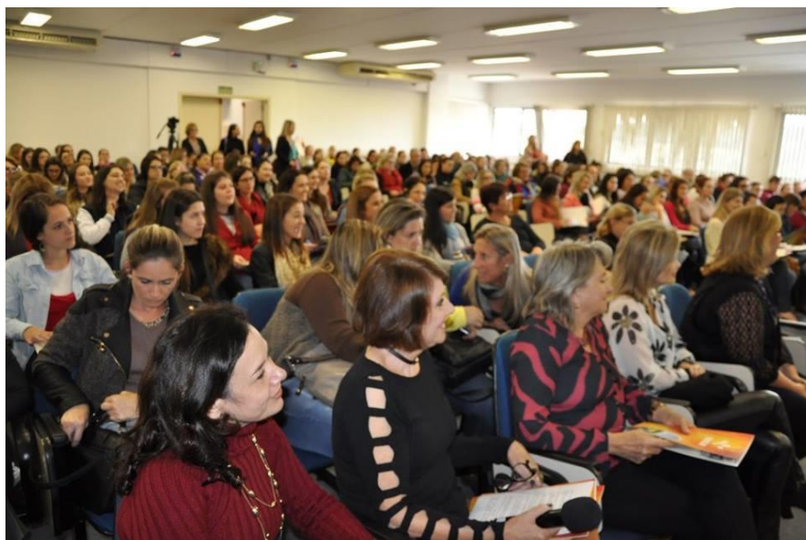
Professores participantes da 1º Encontro

O segundo fascículo versou sobre o tema “Infinitos Universos”. O encontro aconteceu no dia 06/07, das 13h30min às 16h30min, no campus da Faccat. Primeiramente, os participantes dirigiram-se ao auditório da Instituição, a fim de receberem orientações acerca dos projetos que foram desenvolvidos para a Mostratec Júnior, em 2018.