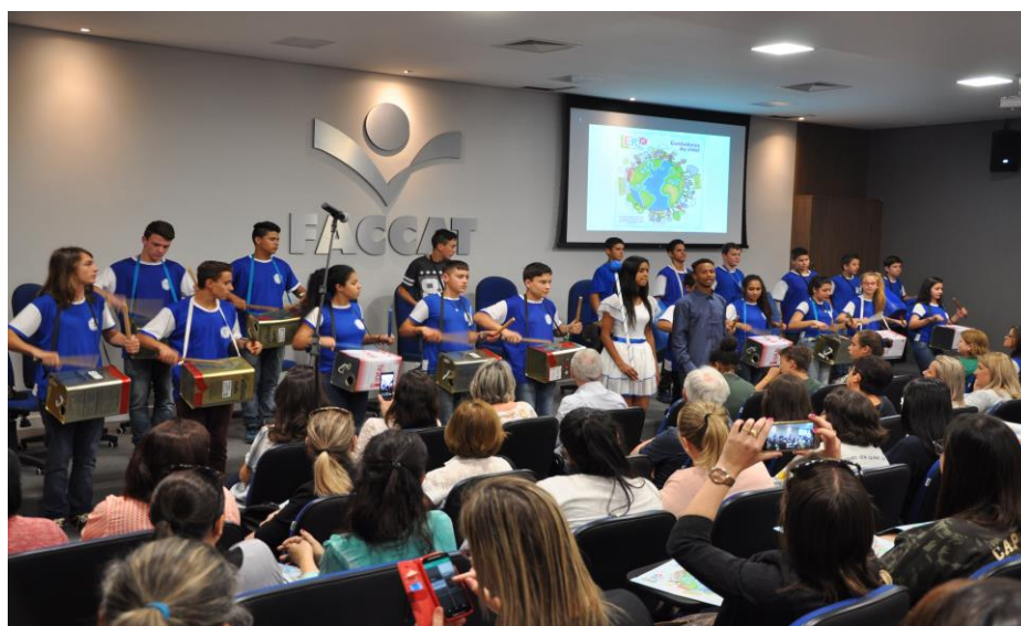
Banda de Lata da EMEF Emílio Leichtveis