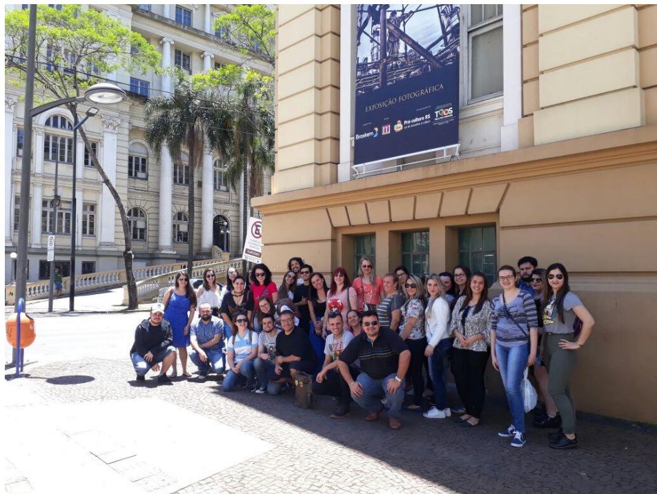
Participantes da visita técnica à 63ª Feira do Livro de Porto Alegre