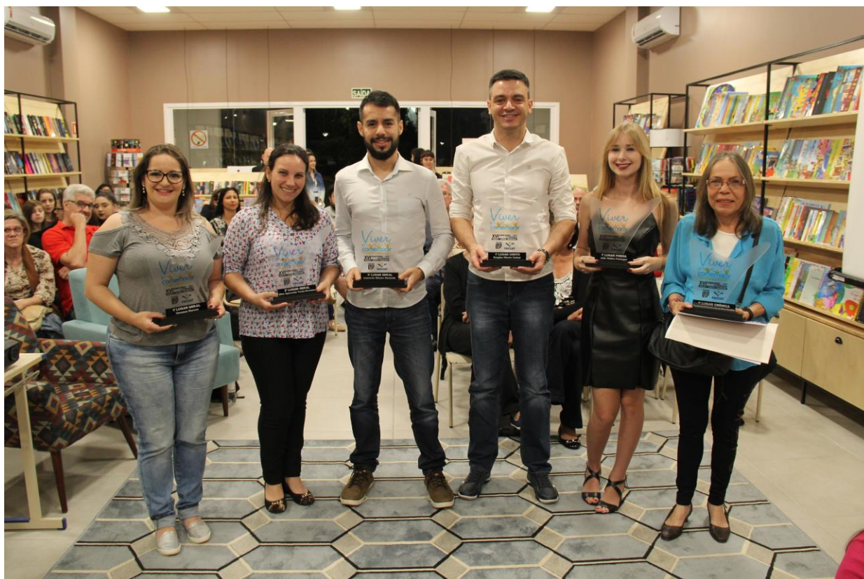
Vencedores do XVI Concurso Literário Faccat/Jornal Panorama 2017.