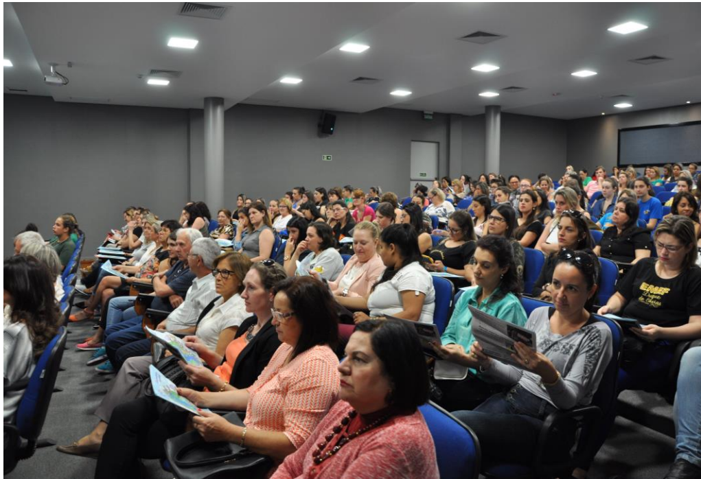
Professores participantes do 3º Encontro

O objetivo geral do Projeto LER é a promoção da cultura científica, buscando aproximar razão e sensibilidade e, com isso, diminuir as fronteiras entre textos científicos e textos literários. Por isso, o Projeto LER... está no terceiro ano de parceria com o projeto Mostratec Júnior, realizada na Fundação Liberato Salzano, que visa a apresentação de trabalhos de pesquisa em diversas áreas, realizados por estudantes do ensino fundamental do Brasil e do Exterior.