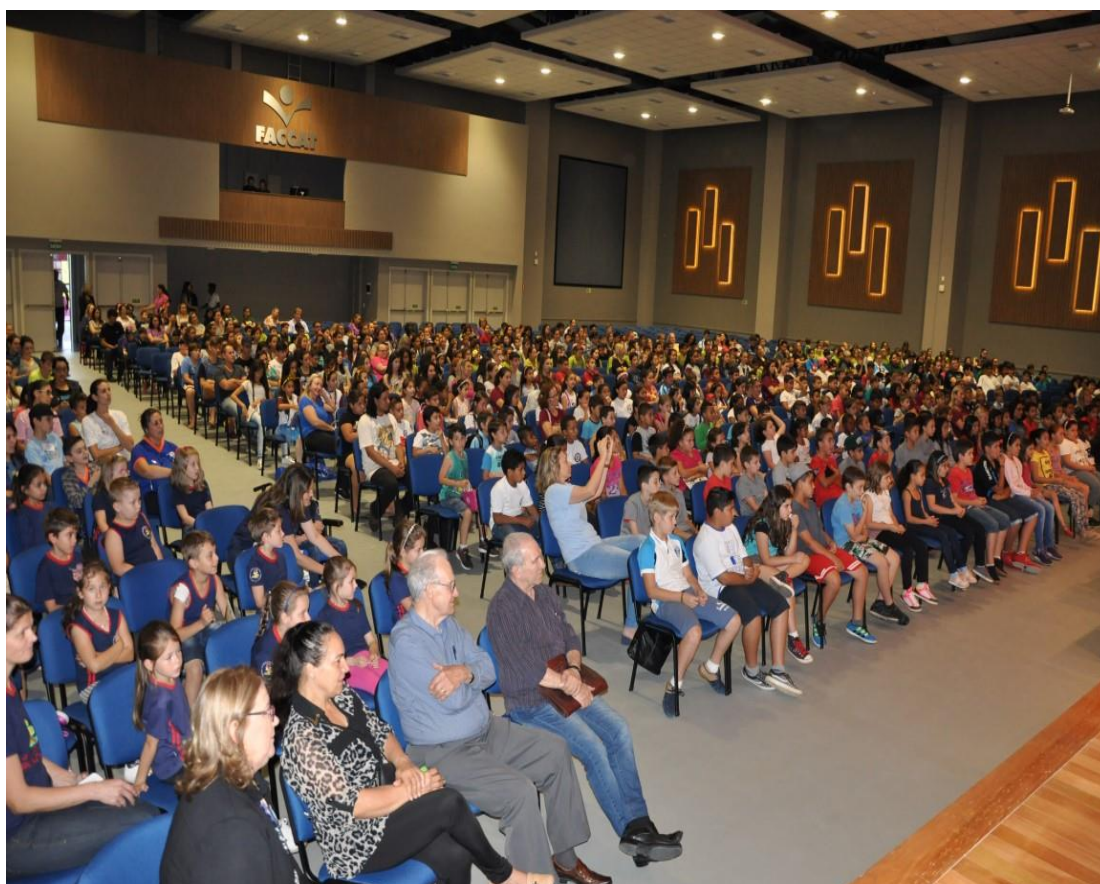
Participantes do Evento de encerramento do Projeto LER...- Literatura e Ciência 2017

Foram sorteados, entre alunos e professores, tablets, headfones e livros. Além disso, houve distribuição de lanches, constituídos por pipoca e água. Os acadêmicos participantes do Pibid também colaboraram na organização de atividades e no ato de conduzir escolas e turmas aos seus respectivos lugares, no auditório principal do Centro de Eventos da Faccat.