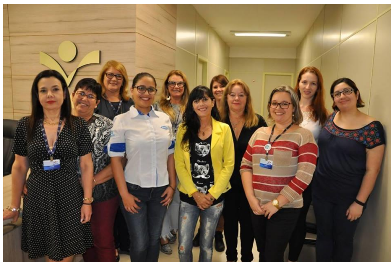
Escritoras participantes do projeto