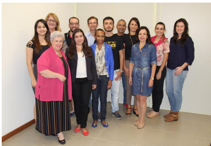
1ª reunião com os acadêmicos-autores e comissão organizadora