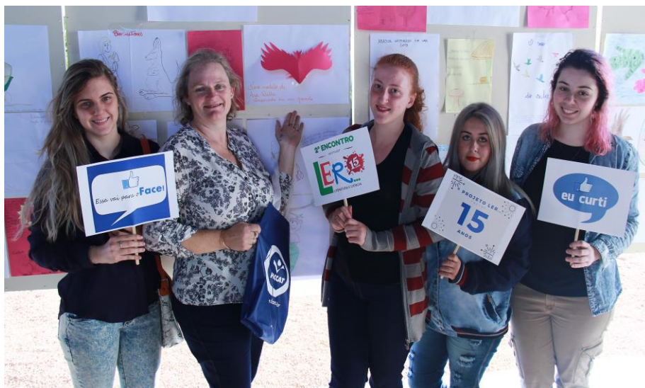
Oficinas em sala de aula

O terceiro fascículo teve como tema “Cuidadores da vida”. O encontro aconteceu no dia 05/10, das 13h30min às 16h30min, no auditório da Faccat.