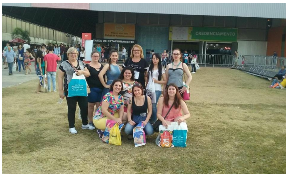
Na XVIII Bienal Internacional do Livro