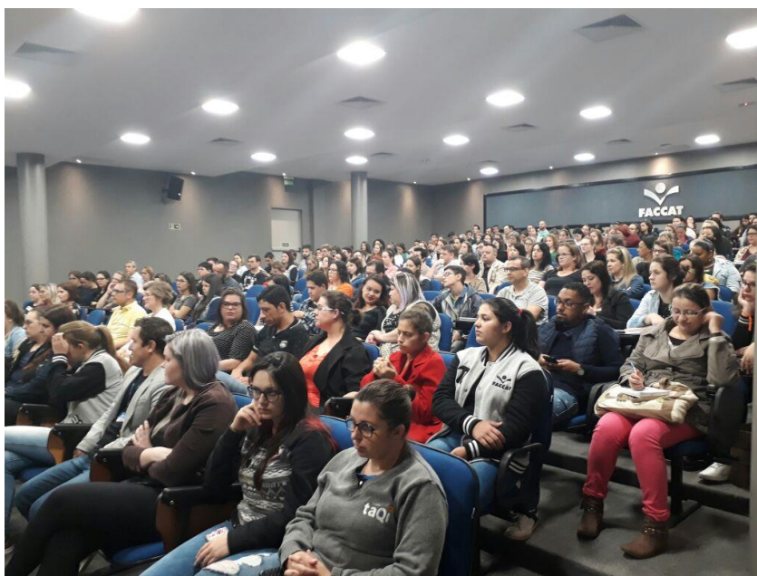
Participantes do II Seminário das Licenciaturas

No encerramento do evento, dia 31/10, foi lançado o Projeto Intervenções Poéticas: Criatividade, Sensibilidade e Empatia no ambiente acadêmico , que tem como objetivo despertar, na comunidade acadêmica, o gosto pela a poesia e demais manifestações artísticas que tenham o signo linguístico como meio de expressão, promovendo também atitudes, valores e emoções intimamente ligados à arte, especialmente no que tange à sensibilidade e ao olhar para o outro.