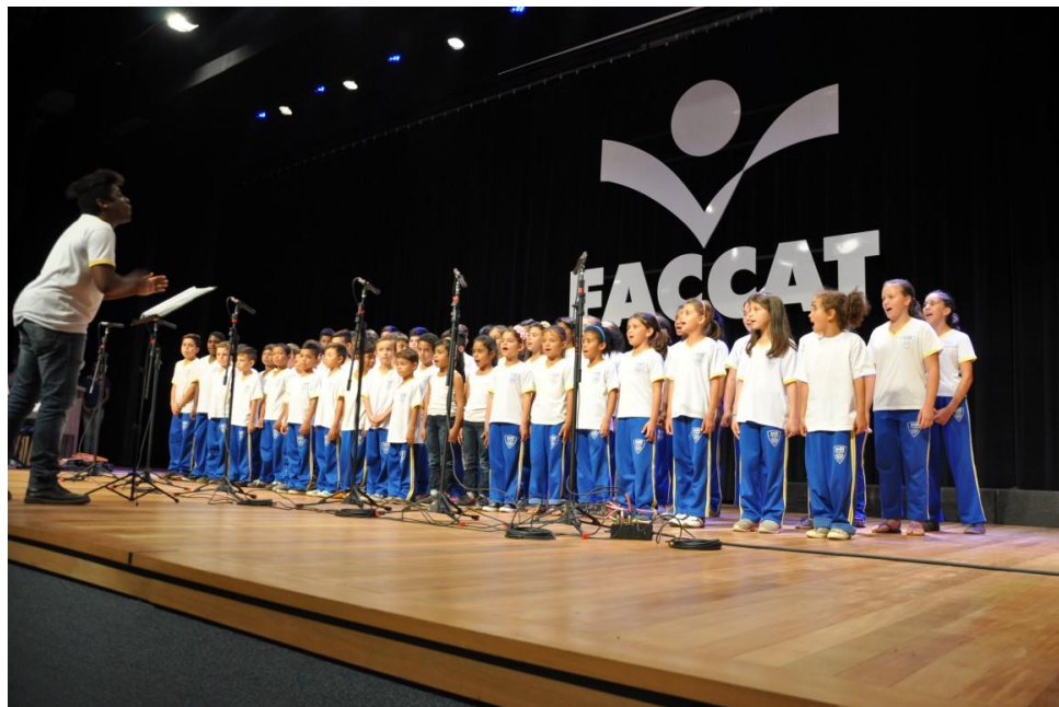
Apresentações artísticas do evento