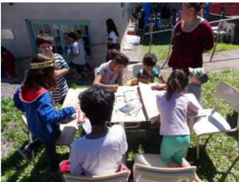
Comunidade participando das atividades.