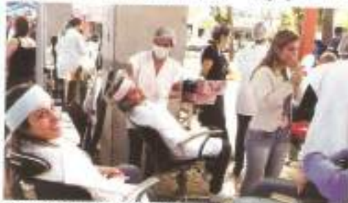
Eventos são organizados por acadêmicos da graduação

Já as Atividades Itinerantes realizadas durante a Semana da Enfermagem fizeram parte da disciplina de Estágio Curricular no Hospital e foram voltadas especificamente às equipes multidisciplinares que atuam nos estabelecimentos abrangidos.