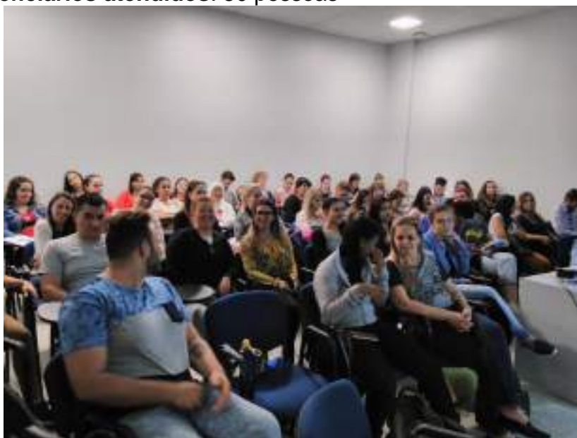
Alunos da disciplina de Vigilância em Saúde e Oficina de Problematização e o Mundo do Trabalho.

Nº total de beneficiários atendidos: 50 pessoas