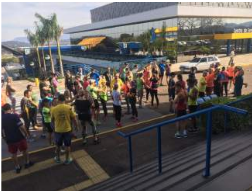
Participantes do Workshop preparam-se para caminhada orientada pelos profissionais convidados.

Nº de beneficiários atendidos de forma gratuita: 100