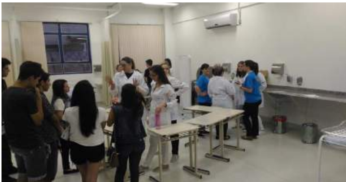
Professores do Curso de Enfermagem e acadêmicos de enfermagem recepcionando alunos do ensino médio em atividades no Laboratório de Enfermagem.