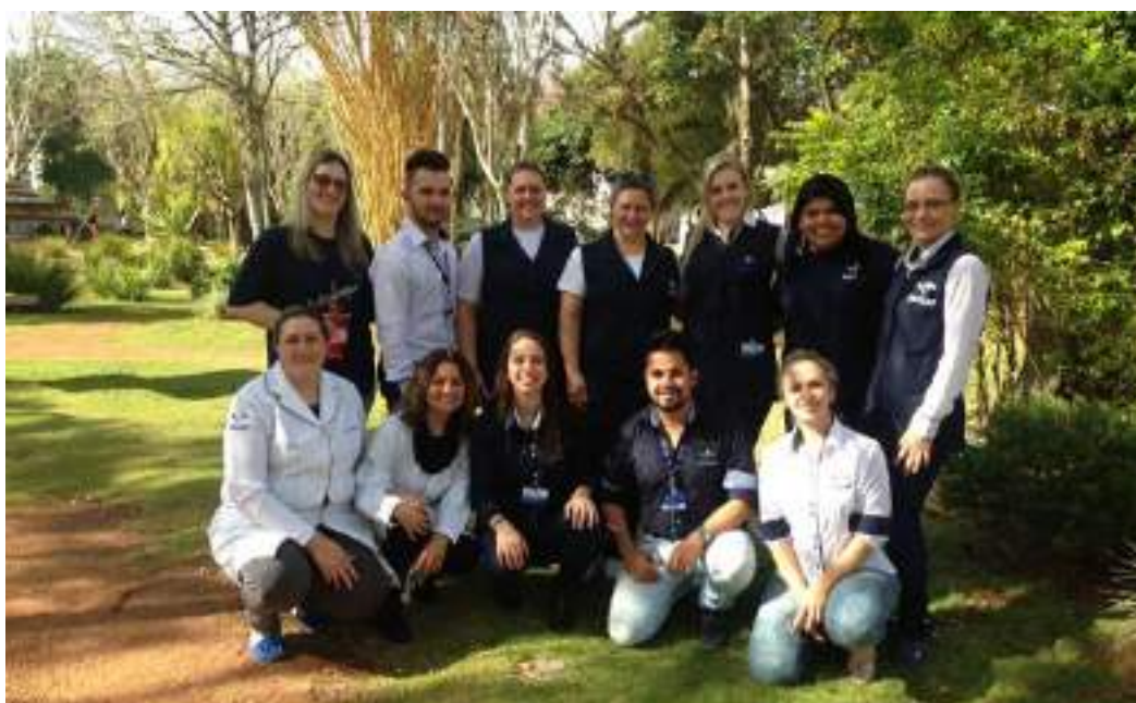
Acadêmicos e professores do Estágio Curricular na Atenção Básica do Município de Taquara/RS.

Nº de beneficiários atendidos de forma não gratuita: 0