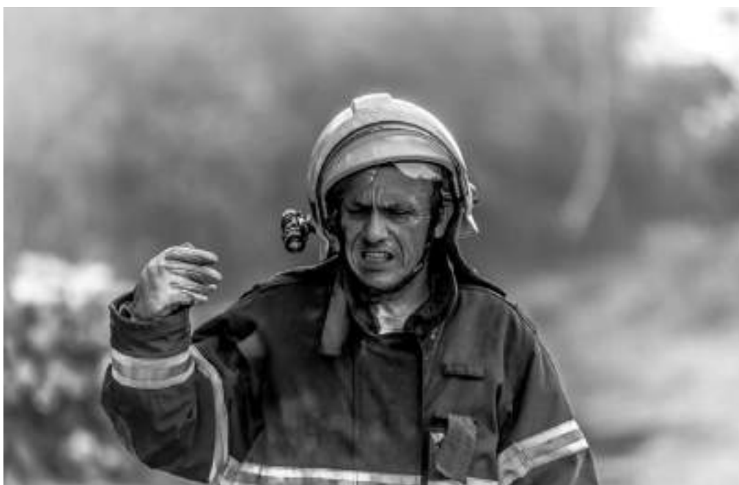
Bombeiros Militares atuaram como instrutores na Simulação de Atendimentos a Múltiplas Vítimas.