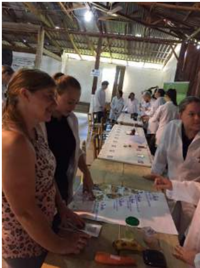
Alunos da disciplina de Cuidados Nutricionais em Saúde oferecendo orientações sobre os cuidados nutricionais e prevenção de doenças.