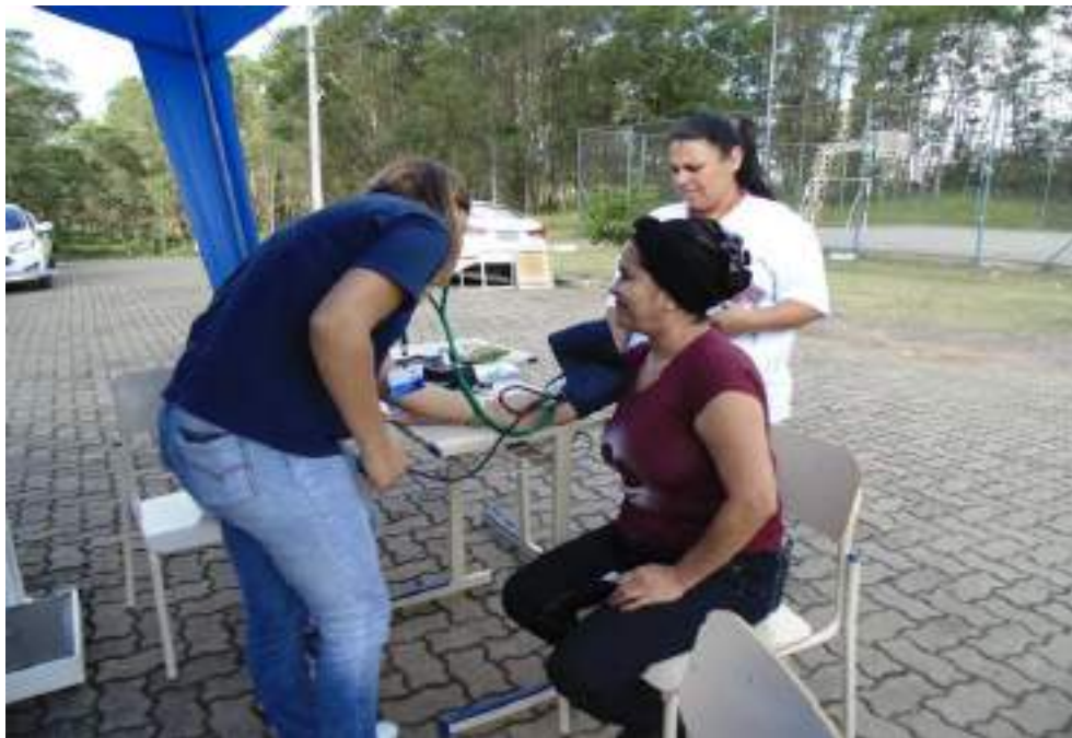
Acadêmica de Enfermagem em atendimento à comunidade local.

Nº de beneficiários atendidos de forma não gratuita: 0