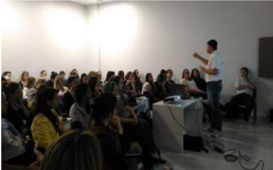
Aula integrada das disciplinas Vigilância em Saúde e Oficina de Problemática e o Mundo do Trabalho.