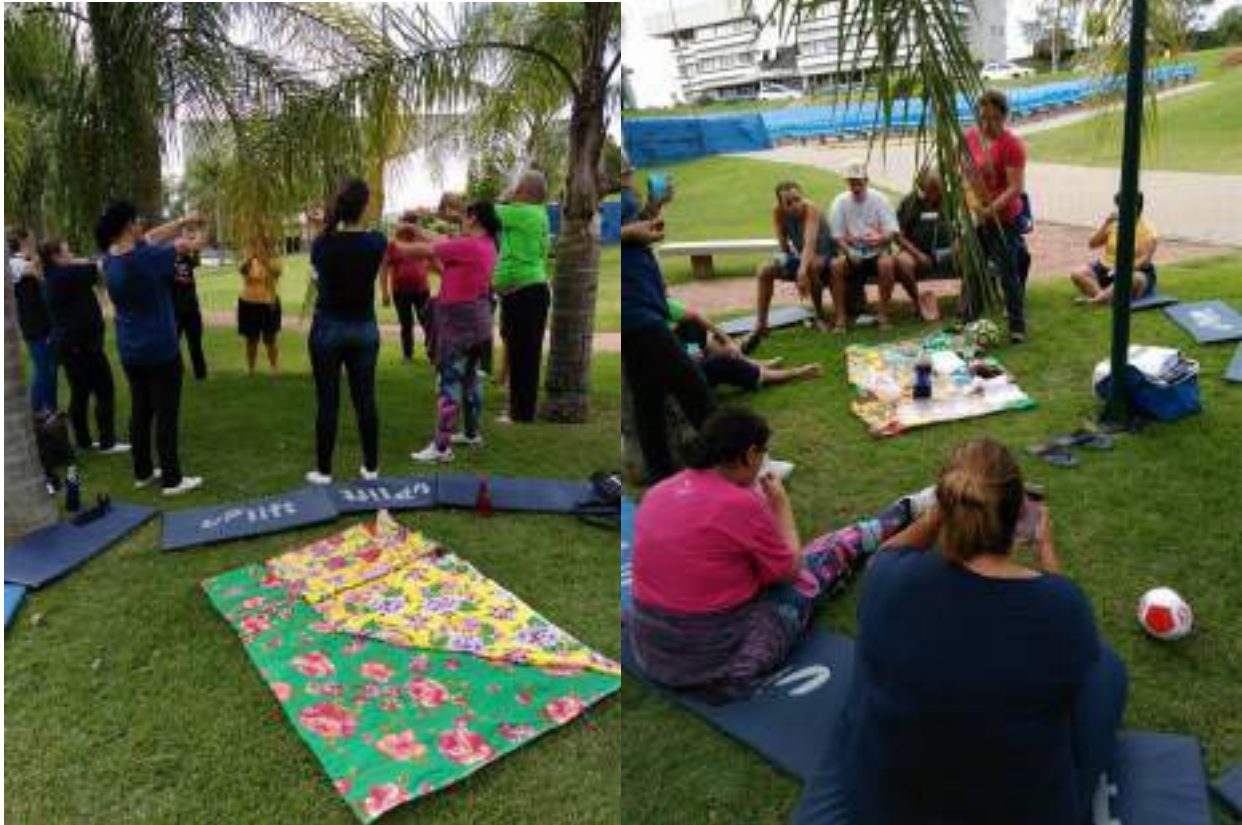
Alunos da disciplina de Saúde Mental II acompanham e conduzem atividades no campus da Faccat com usuários de um Residencial Terapêutico.