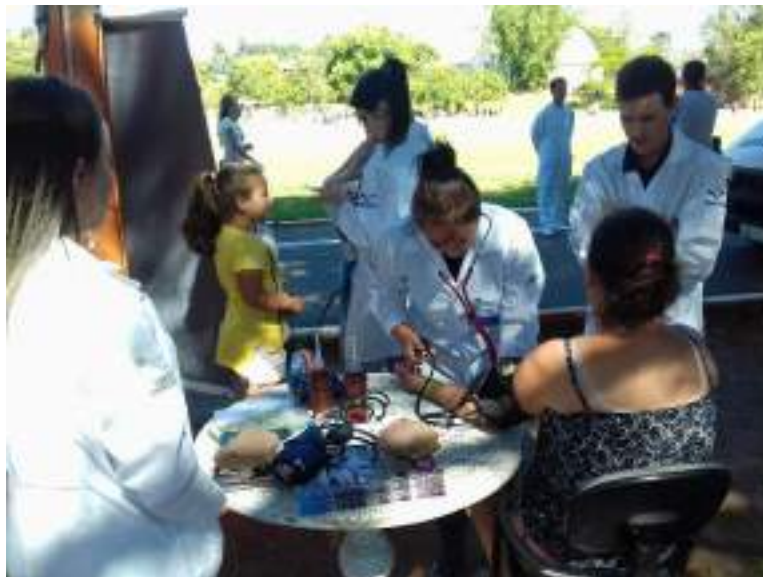
Acadêmicos do curso de Enfermagem realizando aferição de pressão arterial e oferecendo orientações sobre a mudança no estilo de vida.