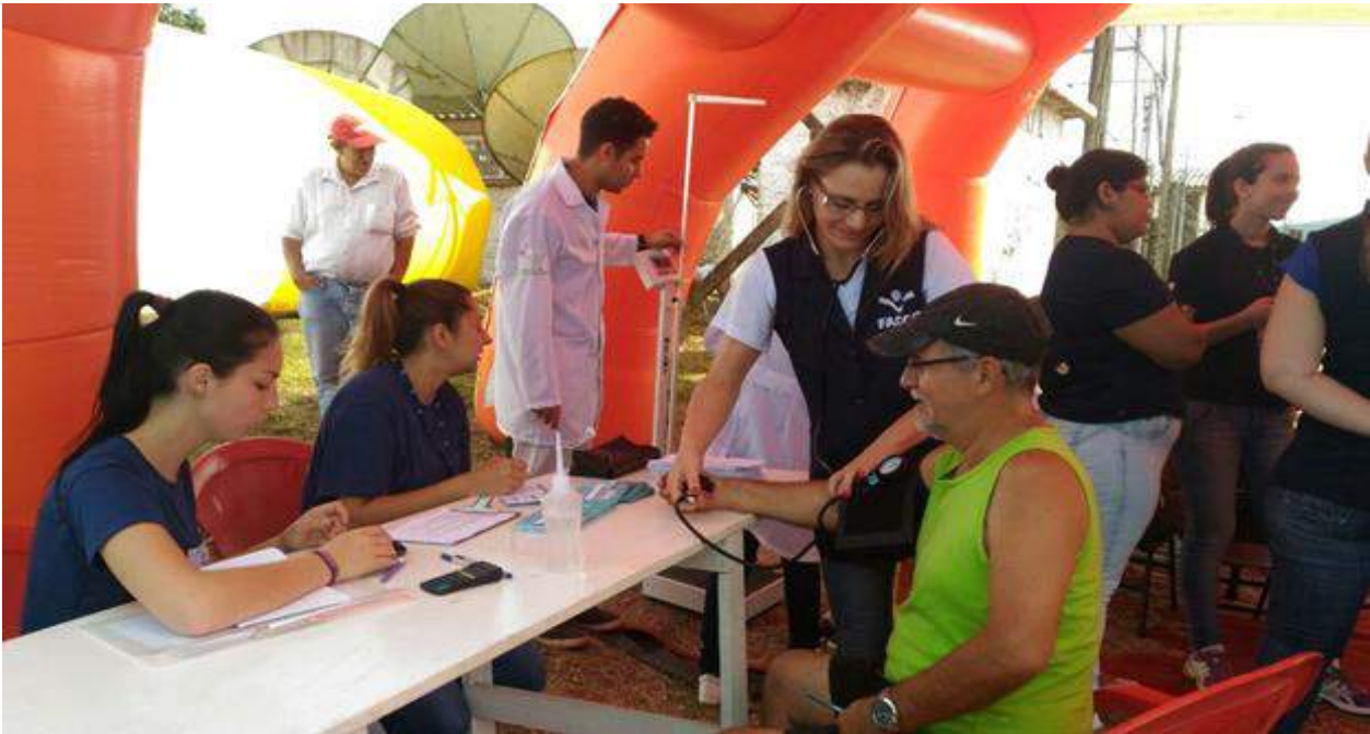
Verificação de IMC, relação cintura-quadril e orientações sobre Risco Cardiovascular.