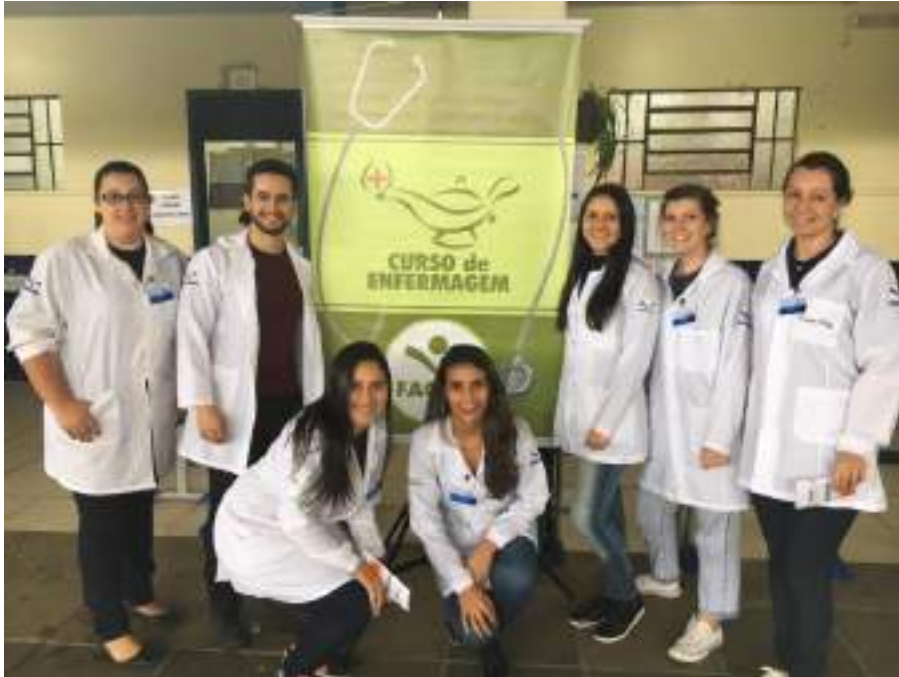
Acadêmicos do curso de Enfermagem na atividade Lions Solidário, em Parobé, RS.