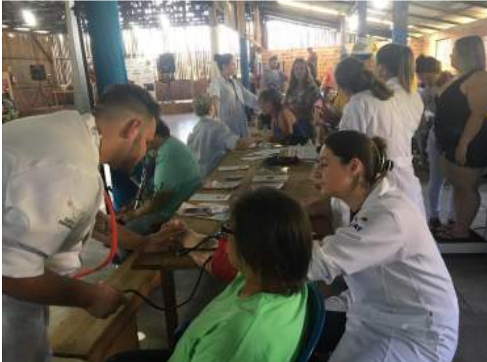
Acadêmicos do curso de Enfermagem realizando aferição de pressão arterial (PA), relação cintura-quadril e prestando orientações para a população.