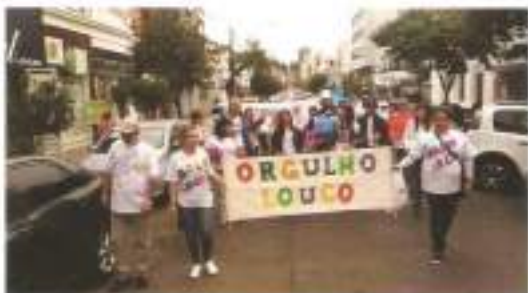
Caminhada em Taquara externou posição antimanicomial