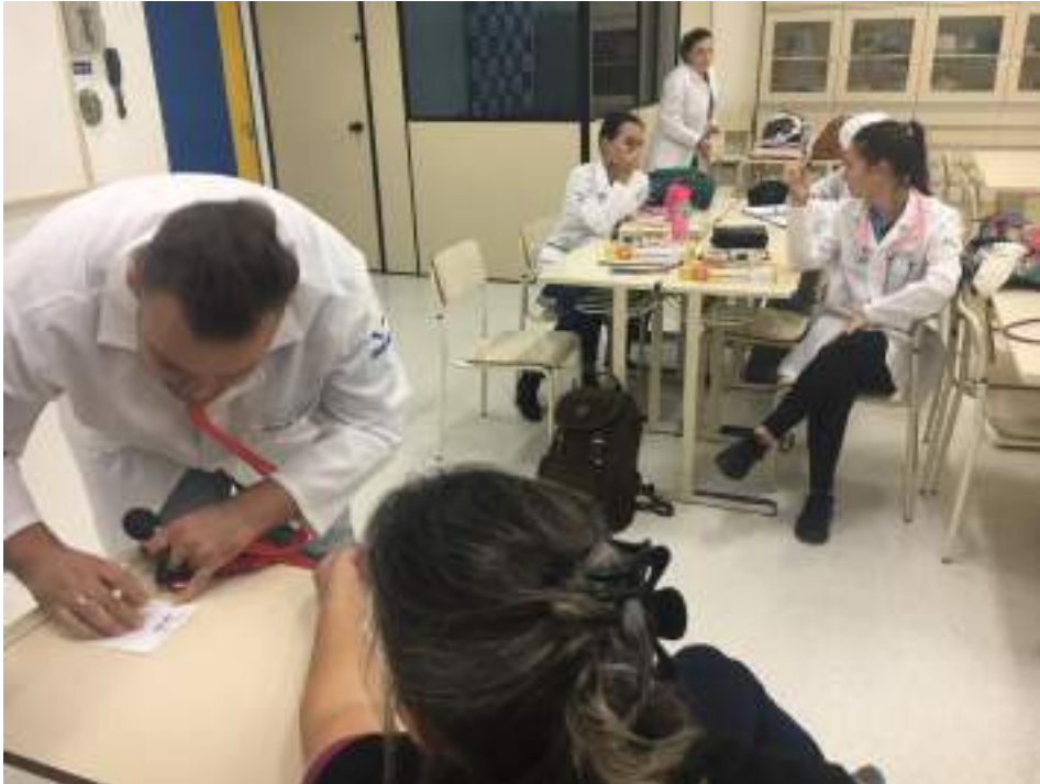
Acadêmicos realizando técnica de verificação de pressão arterial, conforme preconizado pelo Ministério da Saúde.