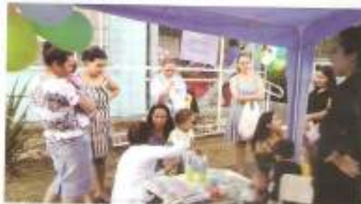
Iniciativas prestaram diversos serviços à comunidade