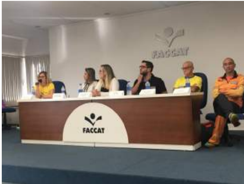
Profissionais de diversas áreas ministram o Workshop