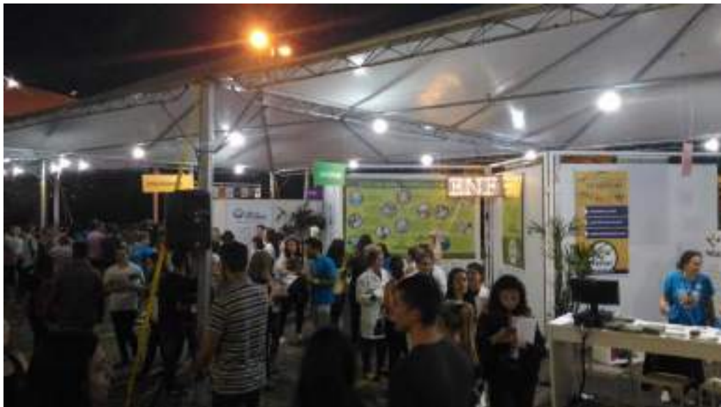
Estande do curso.