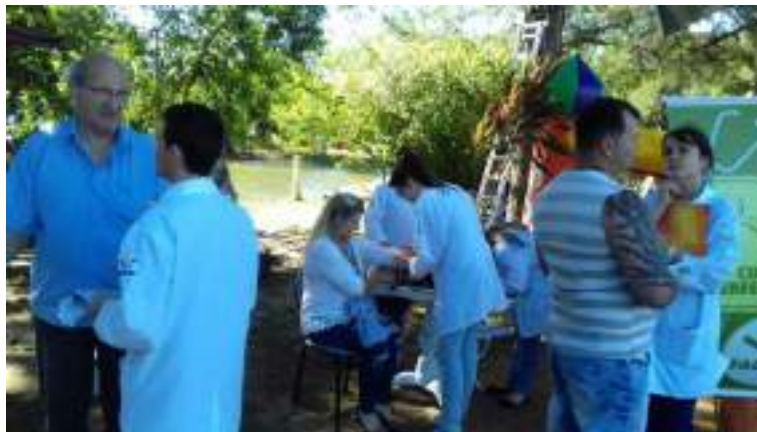
Acadêmicos do curso de Enfermagem realizando aferição de pressão arterial e oferecendo orientações sobre a mudança no estilo de vida