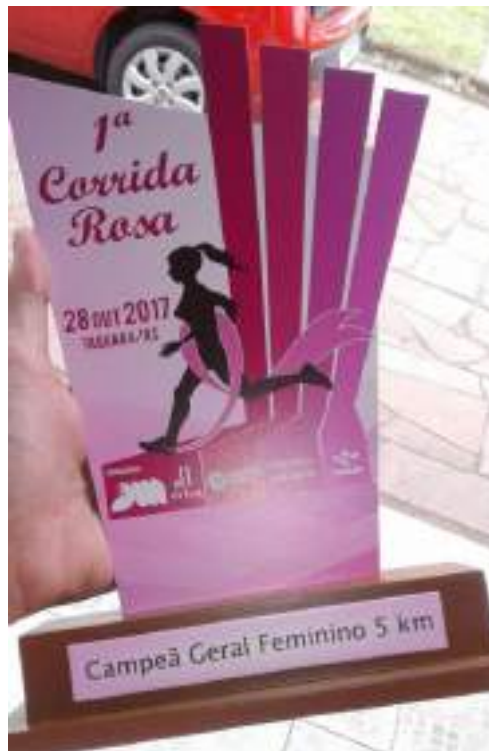
Troféu para participantes da 1ª Corrida Rosa.