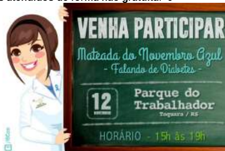
Divulgação da atividade Mateada do Novembro Azul.

Nº de beneficiários atendidos de forma não gratuita: 0