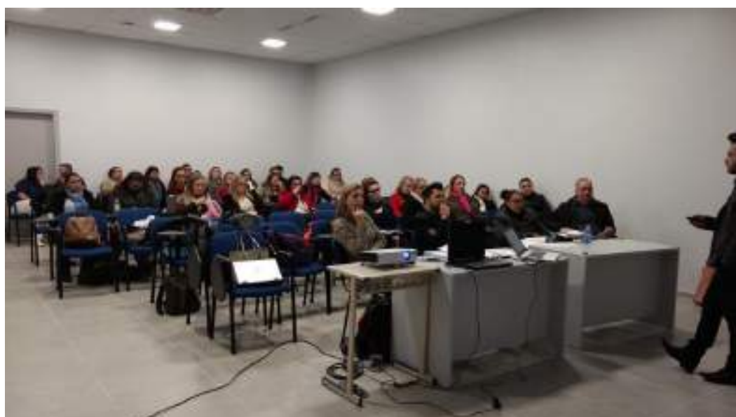
Acadêmico de Enfermagem apresenta seu projeto à banca de qualificação.