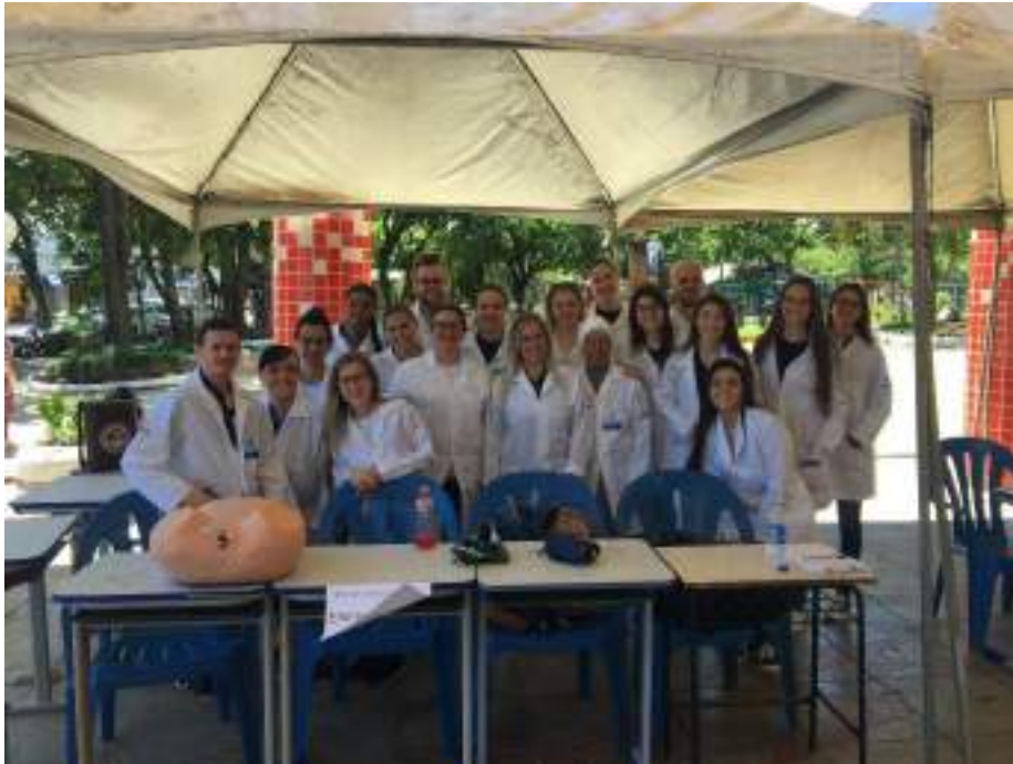
Docentes e acadêmicos da Disciplina de Saúde da Mulher e do Homem.