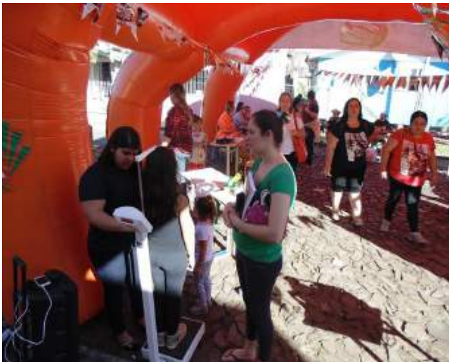
Acadêmica do Curso de Enfermagem realiza verificação de estatura e peso para cálculo de IMC.