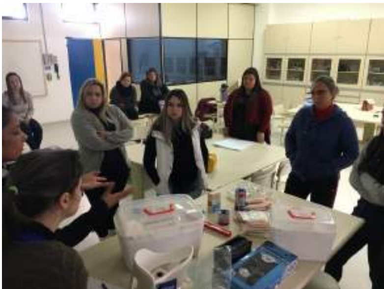
Acadêmicos do Curso de Enfermagem na capacitação da 6ª Trail Run.