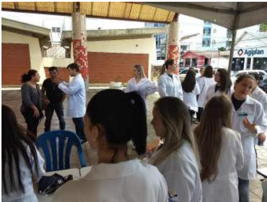
Acadêmicos da disciplina de Processo de Cuidar em Enfermagem II em atendimento à comunidade