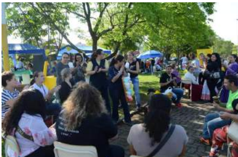
Acadêmicos de Enfermagem conduzem orientação focada na saúde mental.