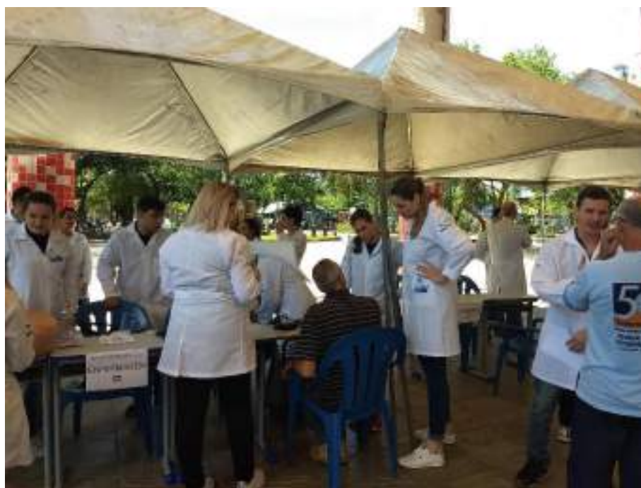
Acadêmico do Curso de Enfermagem fornecendo orientações sobre os exames de rotina que homens e mulheres devem realizar.