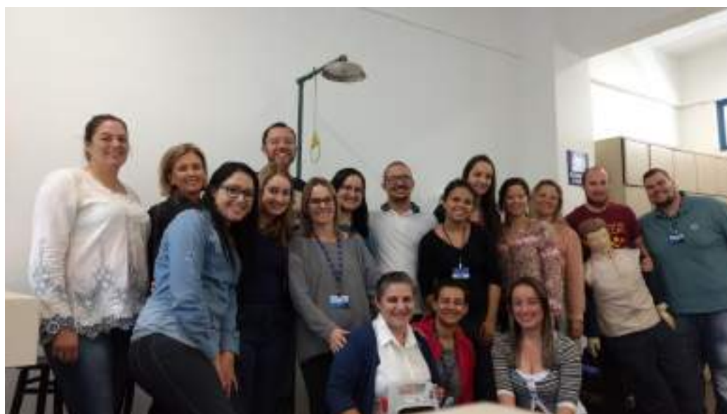
Capacitação dos funcionários da Faccat.

Nº de beneficiários atendidos de forma gratuita: 20