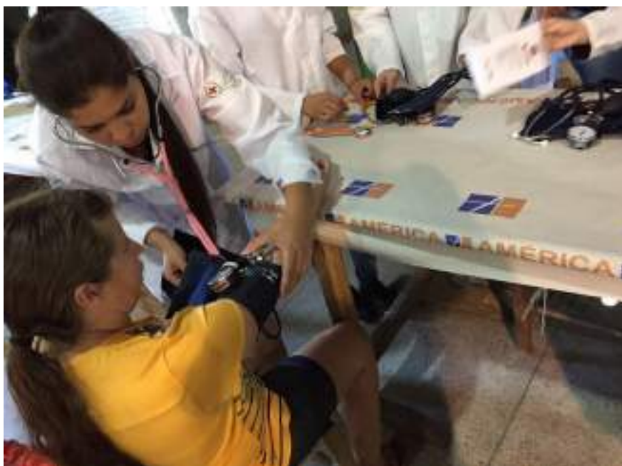
Acadêmica do curso de Enfermagem realizando aferição de pressão arterial.