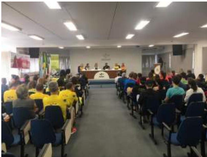
Profissionais de diversas áreas ministram o Workshop