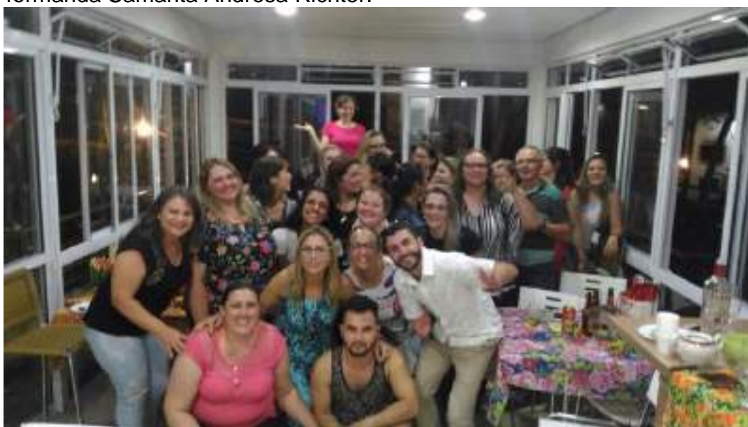
Aula da Saudade