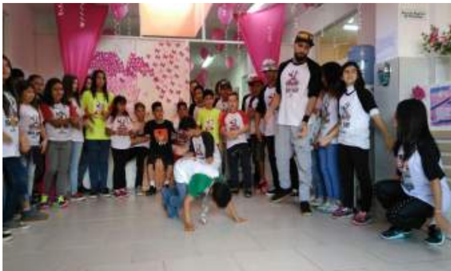
Crianças da ONG Vida Breve realizando apresentação no Evento Outro Rosa.