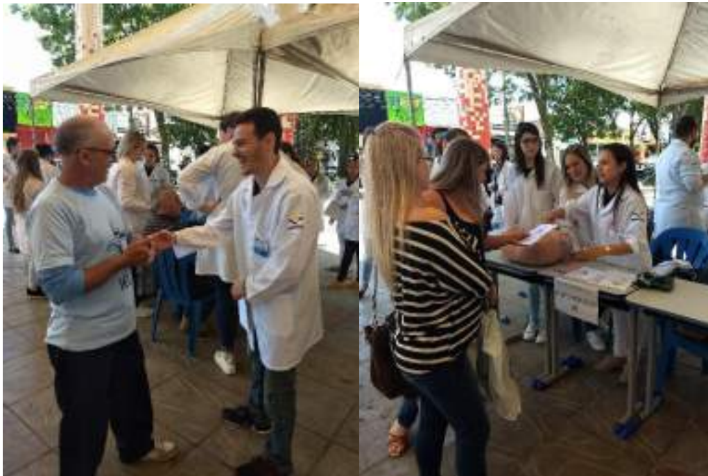
Acadêmicos de Enfermagem em atendimento à comunidade