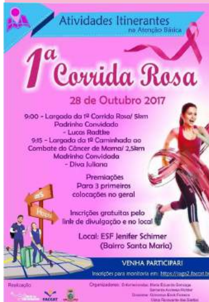
Material de divulgação em mídia social.