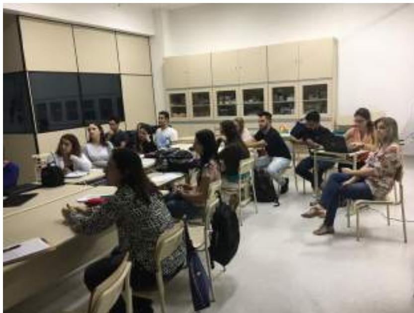
Grupo participa de reunião mensal.