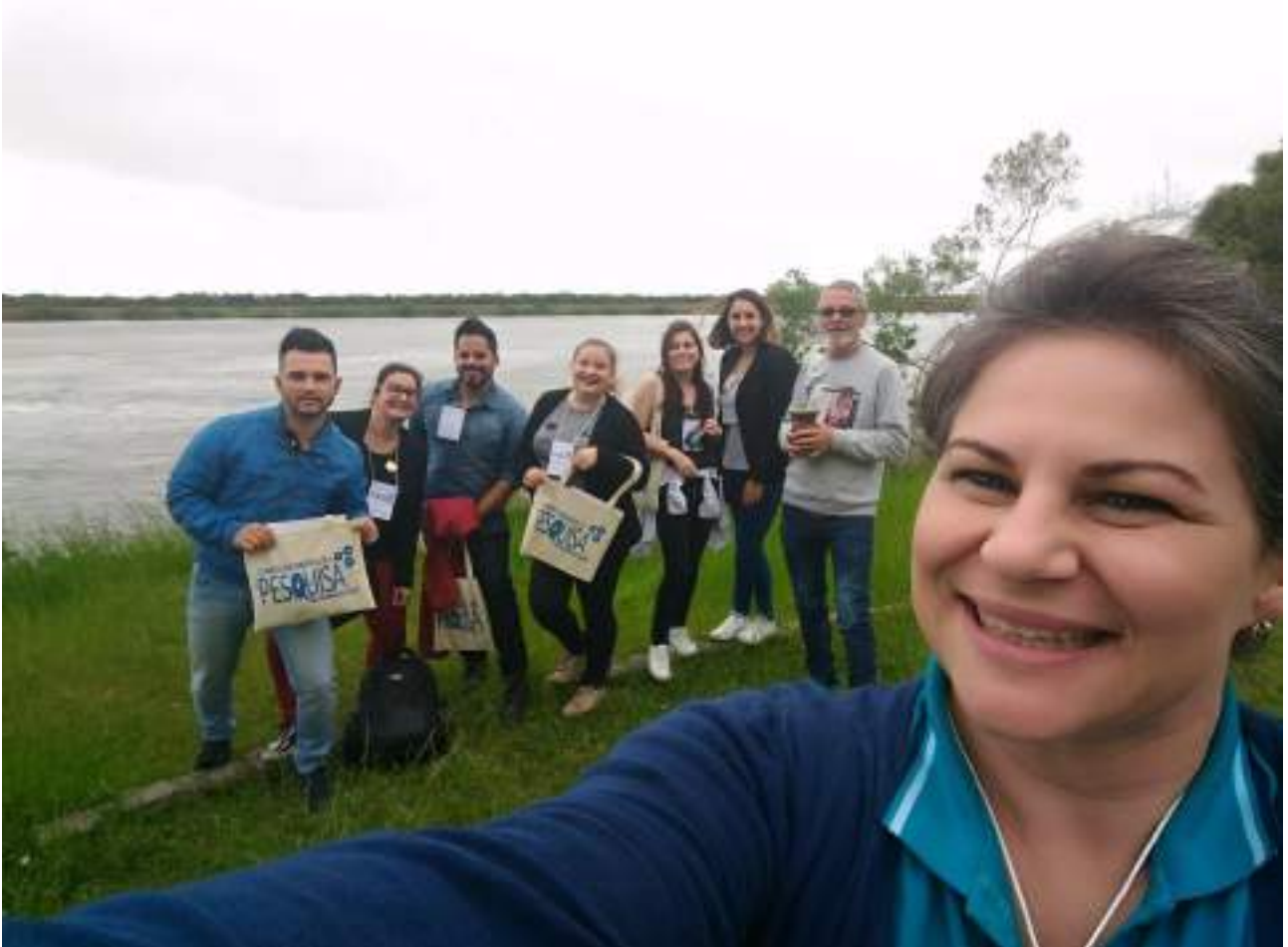
Participantes do Curso de Enfermagem da Faccat no CIPES

Acadêmicos e docentes do Curso de Enfermagem participaram de evento realizado na Universidade Federal de Pelotas (UFPel), nos dias 21 e 22 de setembro de 2017.