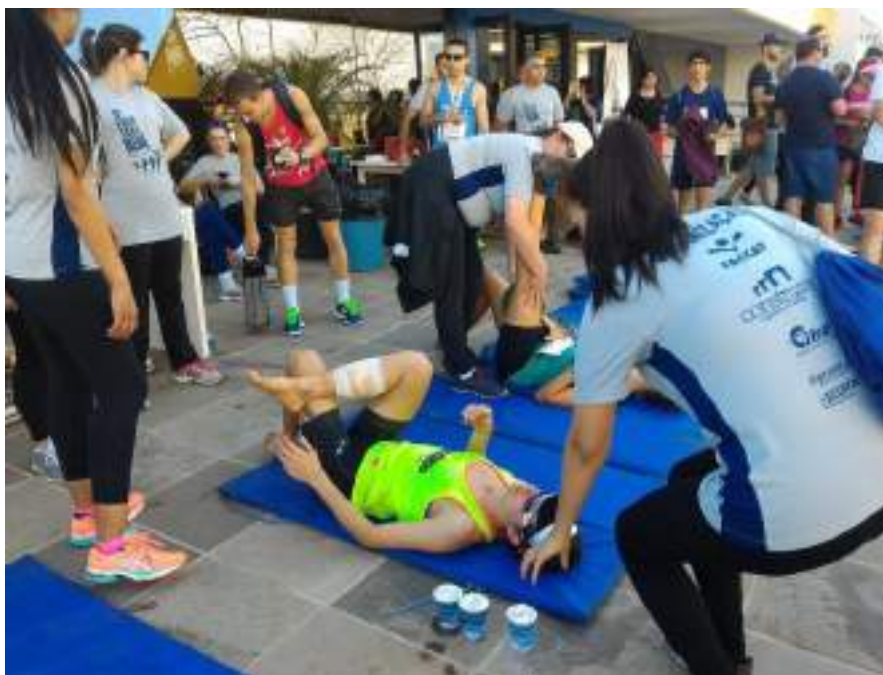
Acadêmicos de Enfermagem prestam atendimento aos atletas (manejo de câimbras)