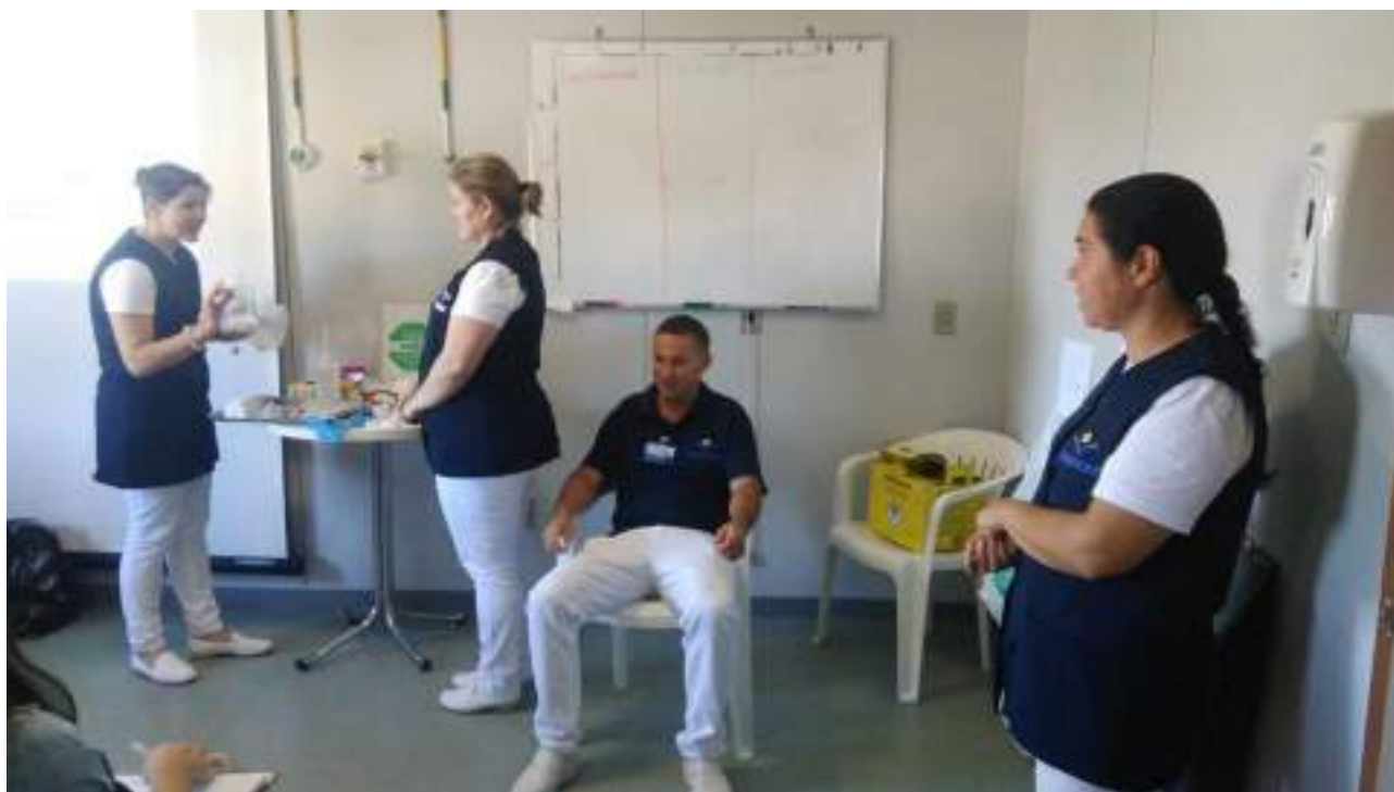
Estagiários em abordagem do tema NR32.

Nº de beneficiários atendidos de forma gratuita: 25