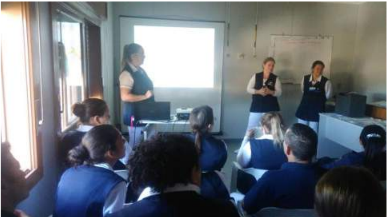
Acadêmicas explanam a colegas e colaboradores do HSFA.

Nº de beneficiários atendidos de forma gratuita: 20