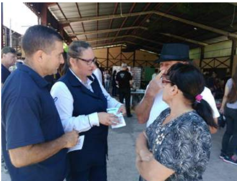
Acadêmicos do curso de Enfermagem participando do Evento comunitário em parceria com a Secretaria de Saúde de Igrejinha e a associação automobilísticos.