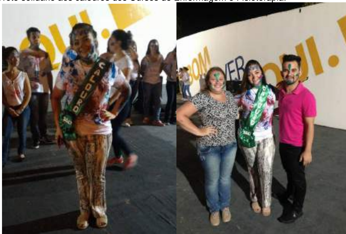
Representantes discentes fazem entrega de faixa para caloura.