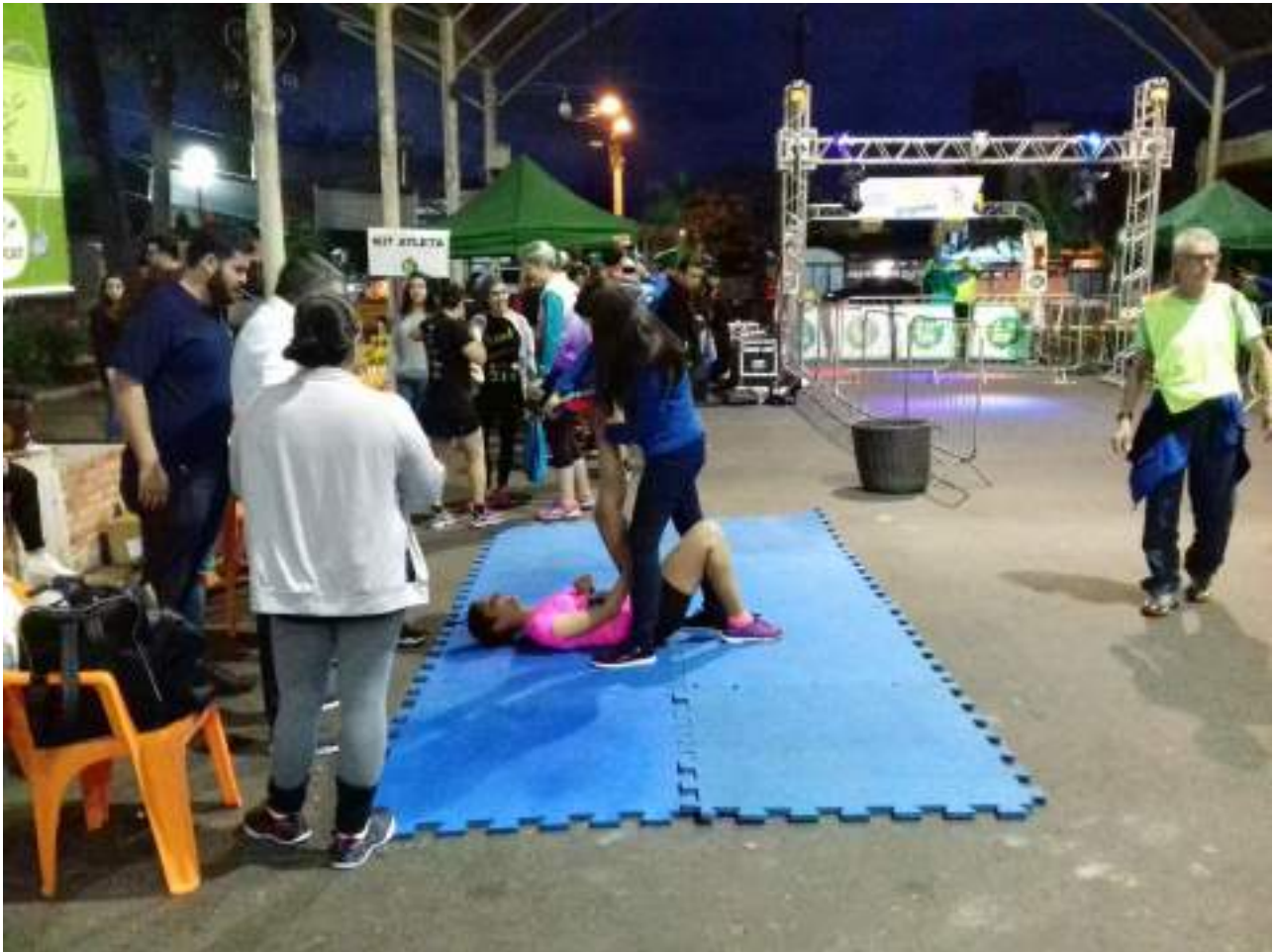
Acadêmicos de Enfermagem prestando atendimento aos atletas participantes da II Night Run Igrejinha.