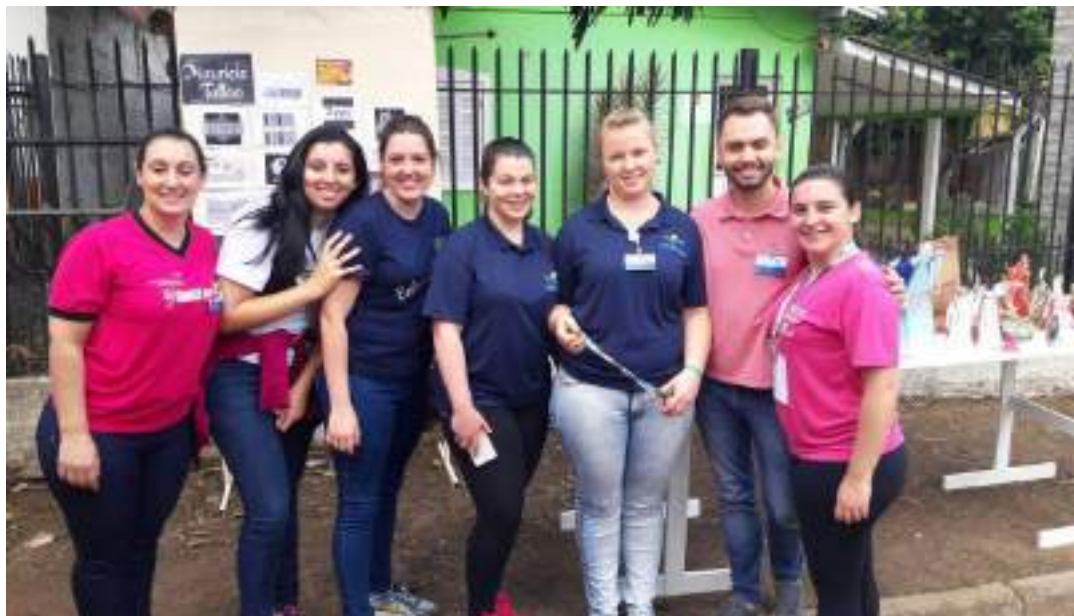
Acadêmicos do Curso de Enfermagem envolvidos na atividade do Outubro Rosa.