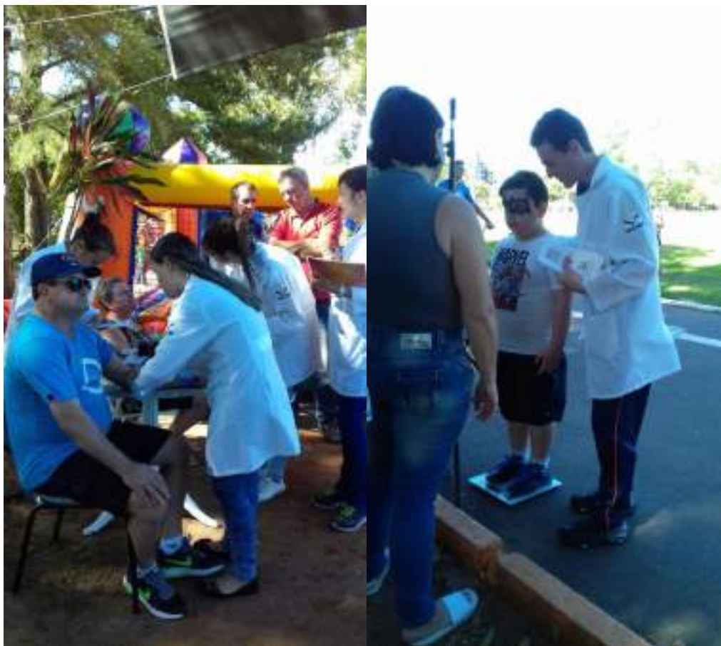
Acadêmicos do curso de Enfermagem realizando aferição de pressão arterial e verificação de estatura para realizar o cálculo do Índice de Massa Corporal- IMC.