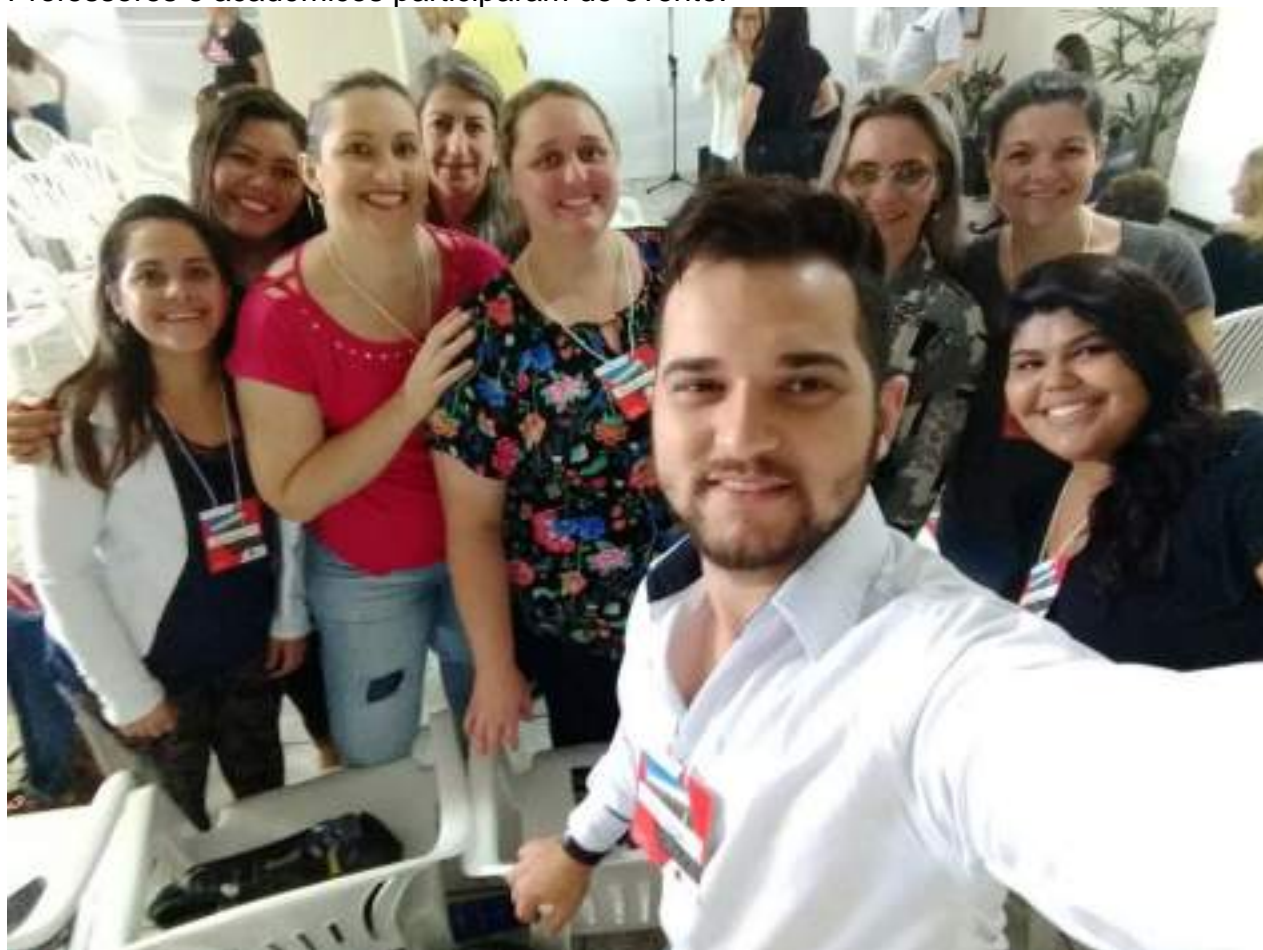
Acadêmicos durante o evento.