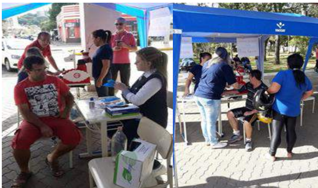
Acadêmicos em atendimento à comunidade local.