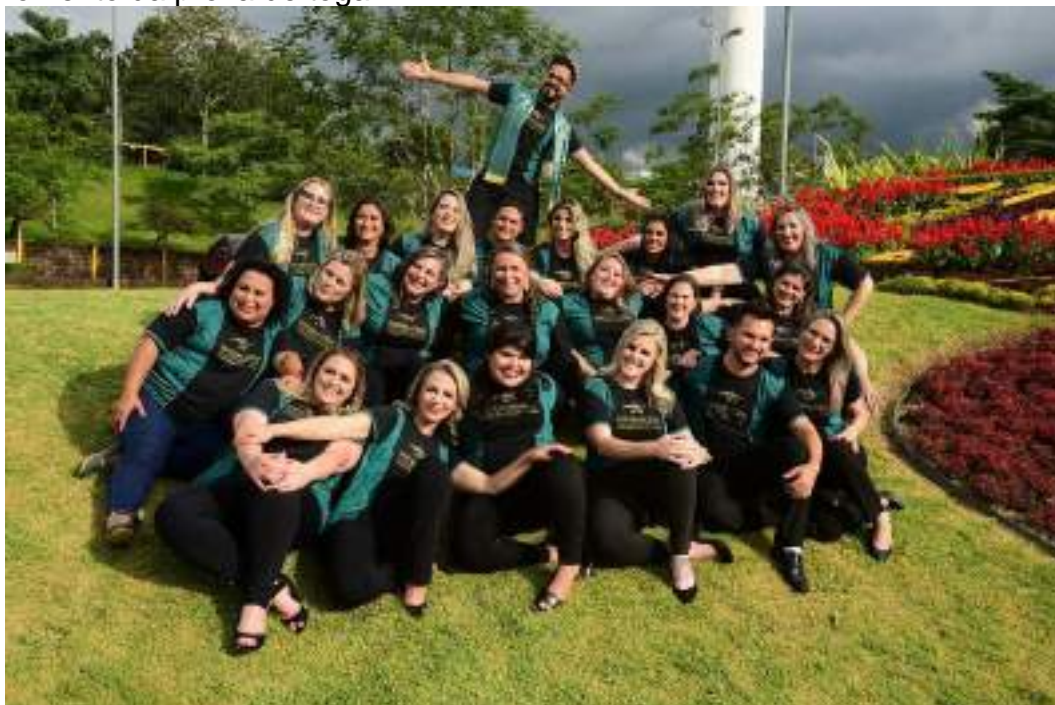
Momento da prova de toga.