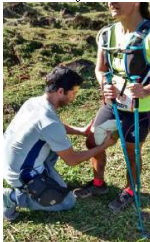
Acadêmicos e professores de Enfermagem e Fisioterapia atendem a atletas ao longo do trajeto.