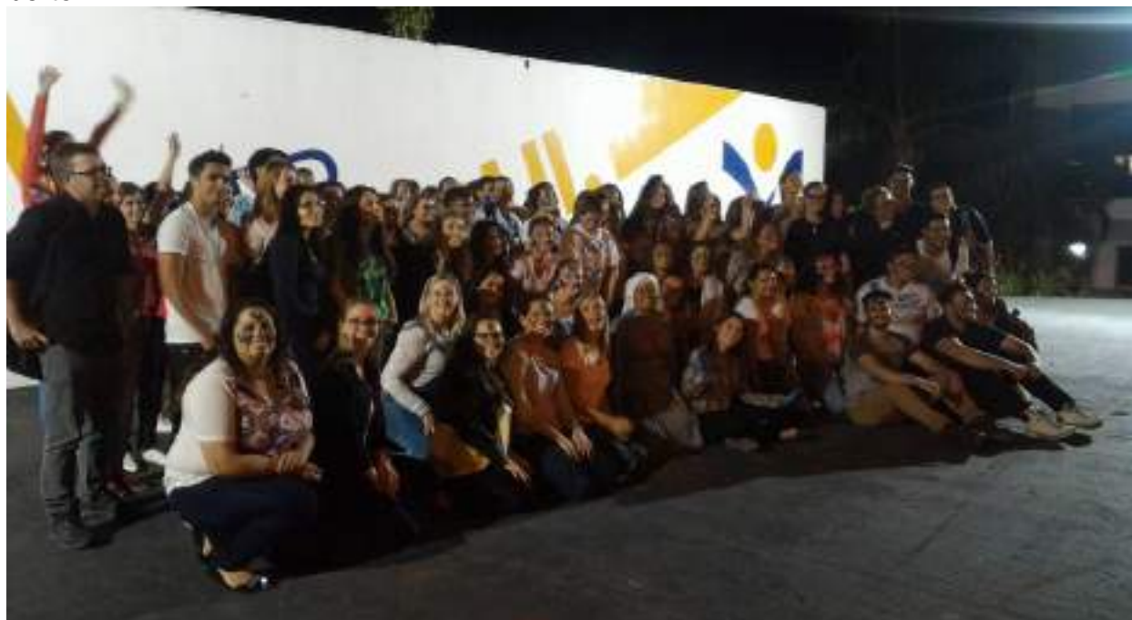
Trote solidário aos calouros dos Cursos de Enfermagem e Fisioterapia.

Descrição: No dia 13/03/2017, os calouros foram recepcionados pelos acadêmicos veteranos e professores dos cursos de Enfermagem e Fisioterapia, em atividade no Palco Aberto.