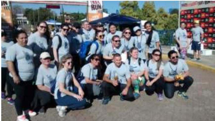
Acadêmicos e professores do Curso de Enfermagem.