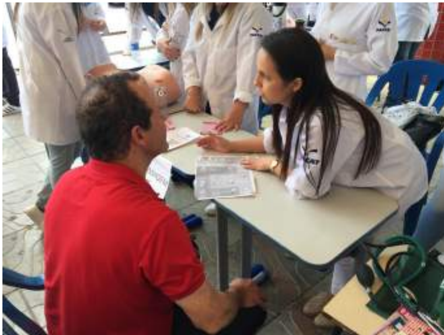
Alunos do Curso de Enfermagem realizam orientações de educação em saúde.

Nº de beneficiários atendidos de forma gratuita: 105