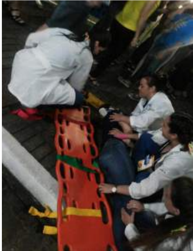
Alunos do Curso de Graduação em Enfermagem realizando simulação durante o Conexão Faccat.