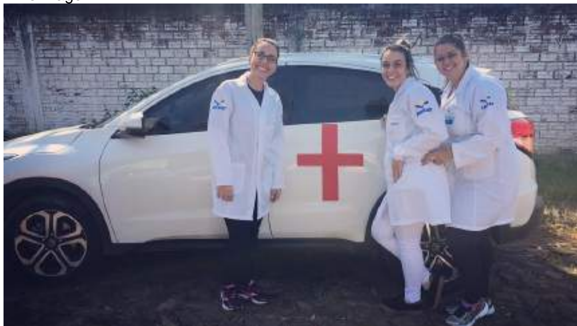
Simulação de ambulância para receber os visitantes.