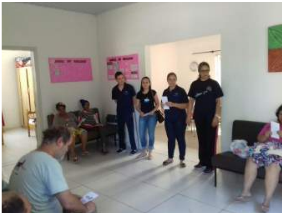
Acadêmicos de Enfermagem da disciplina de Farmacologia I, participaram da atividade Farmacologia para a comunidade.