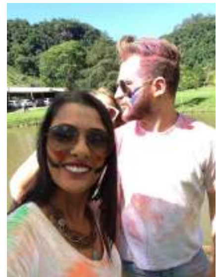
Guerra de tintas