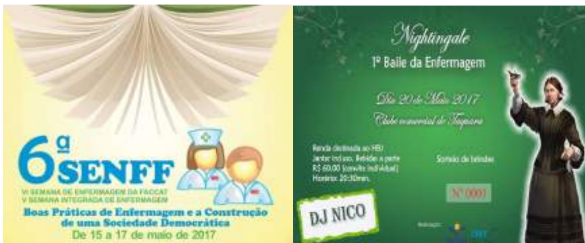
Programação da 6ª SENFF e programação do 1ª Baile de Enfermagem.

Na sequência, apresentamos a chamada do evento, convite do baile e matéria veiculada na Revista Horizontes, de agosto de 2017.