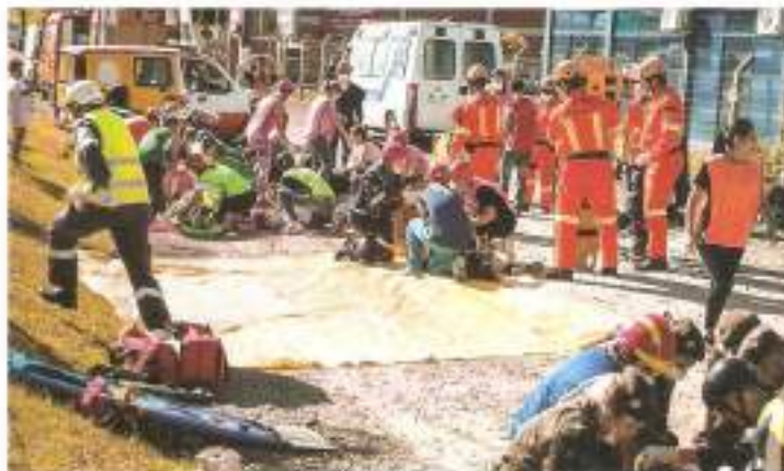
Curso de Atendimento de Múltiplas Vítimas teve simulações de acidentes

No dia 18, ocorreu a Caminhada Antimanicomial, no centro de Taquara, envolvendo pacientes do Serviço de Atenção Psicossocial, que desfilaram juntamente com professores, alunos e profissionais da área, levando faixas e cartazes alusivos ao movimento Orgulho Louco, contrário à internação de pessoas que sofrem algum tipo de pa-