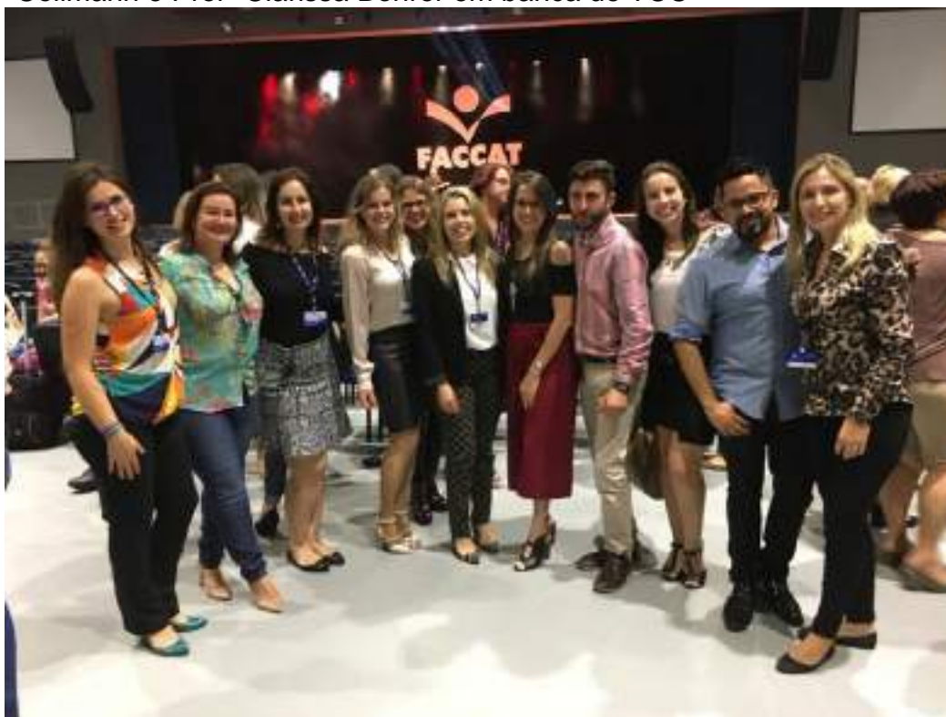
Docentes de Enfermagem participam de confraternização após as bancas.