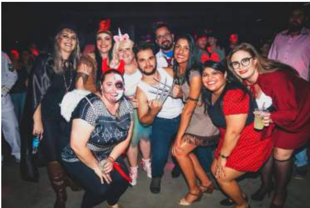
Festa dos 100 dias – A fantasia.