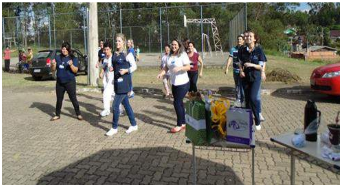
Acadêmicos de Enfermagem e profissionais de saúde da ESF Gilberto do Amaral Saraivo realizam atividade física com a comunidade do Bairro Eldorado - Taquara - RS