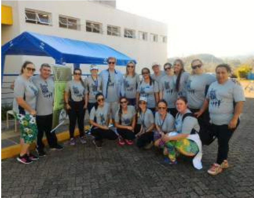
Alunos e professores dos cursos de Enfermagem e Fisioterapia compuseram a equipe de atendimento em primeiros socorros.