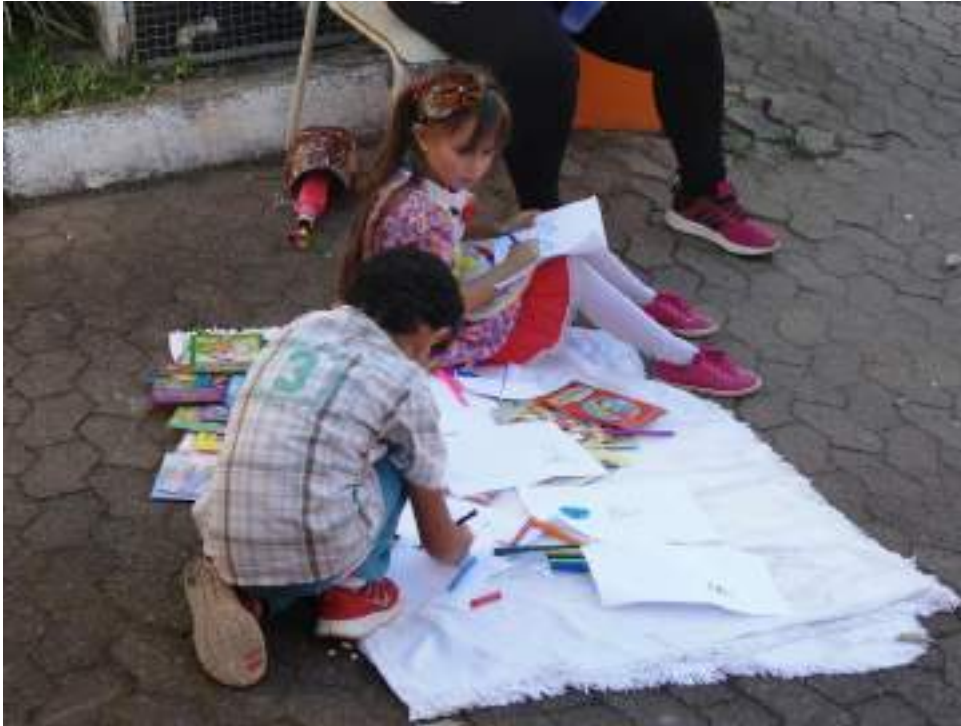
Atividade lúdica desenvolvida com as crianças.