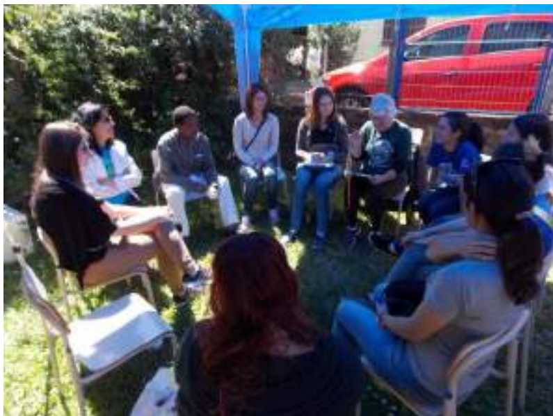
Alunos da disciplina de Prática do Cuidado V, em roda de conversa sobre orientações de Hipertensão.

Nº de beneficiários atendidos de forma gratuita: 50