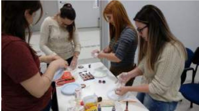
Acadêmicas de Enfermagem participantes da oficina.