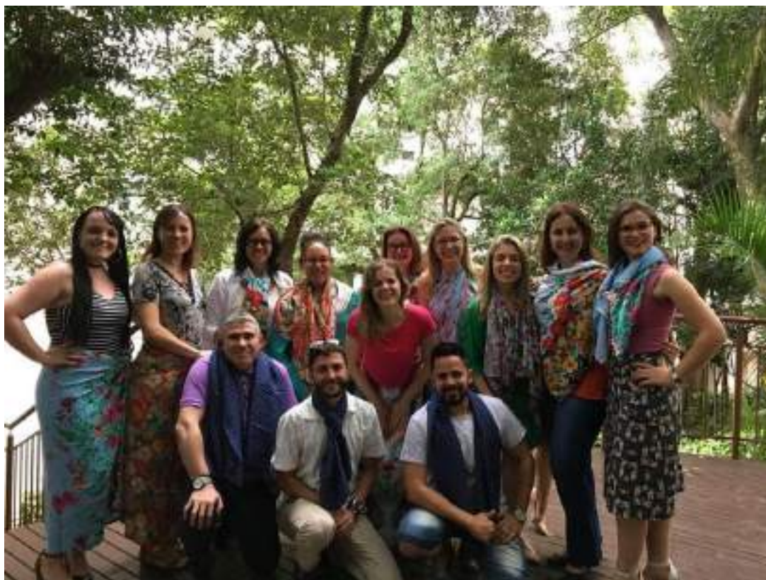
Reunião de Colegiado, seguida de confraternização, realizada em dezembro, em Porto Alegre, RS.