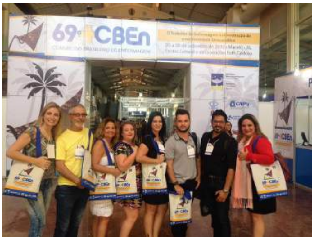
Docentes, acadêmicos e egressa do Curso de Enfermagem.