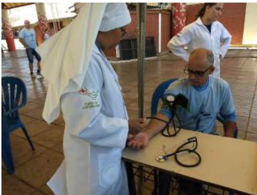
Acadêmica do Curso de Enfermagem realizando aferição de pressão arterial.