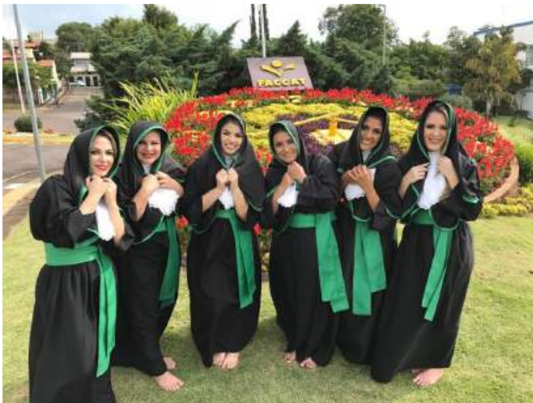
Momento da prova de toga.