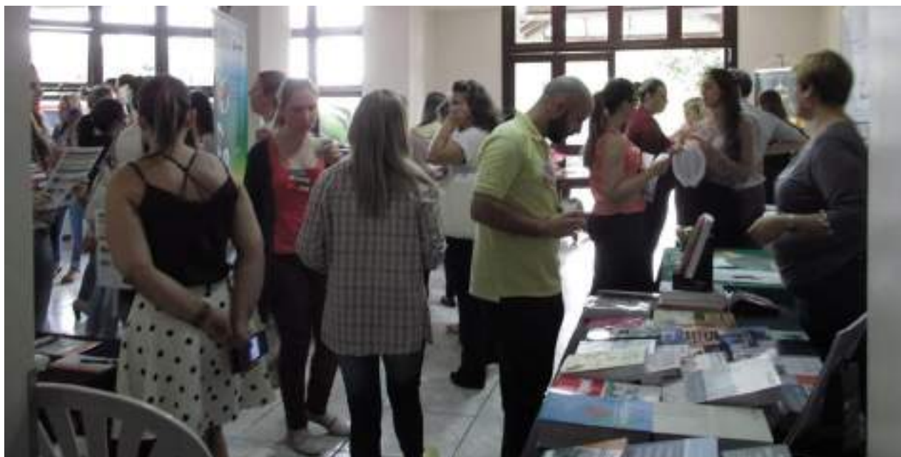
Professores e acadêmicos participaram do evento.