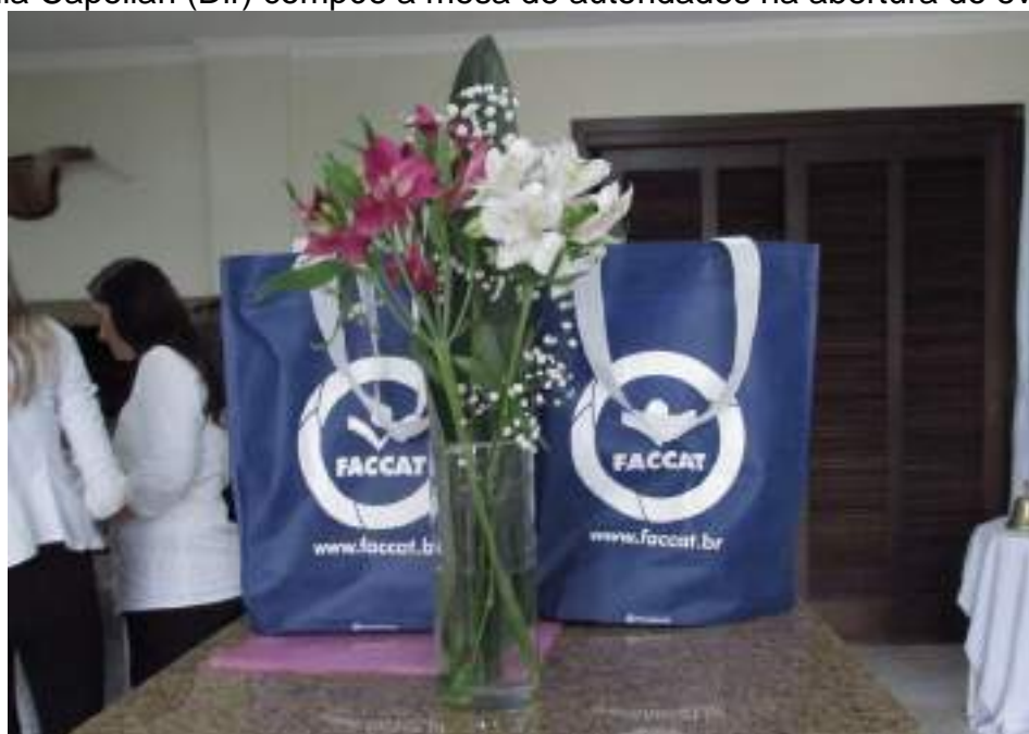
Lunch box patrocinado pela Faccat