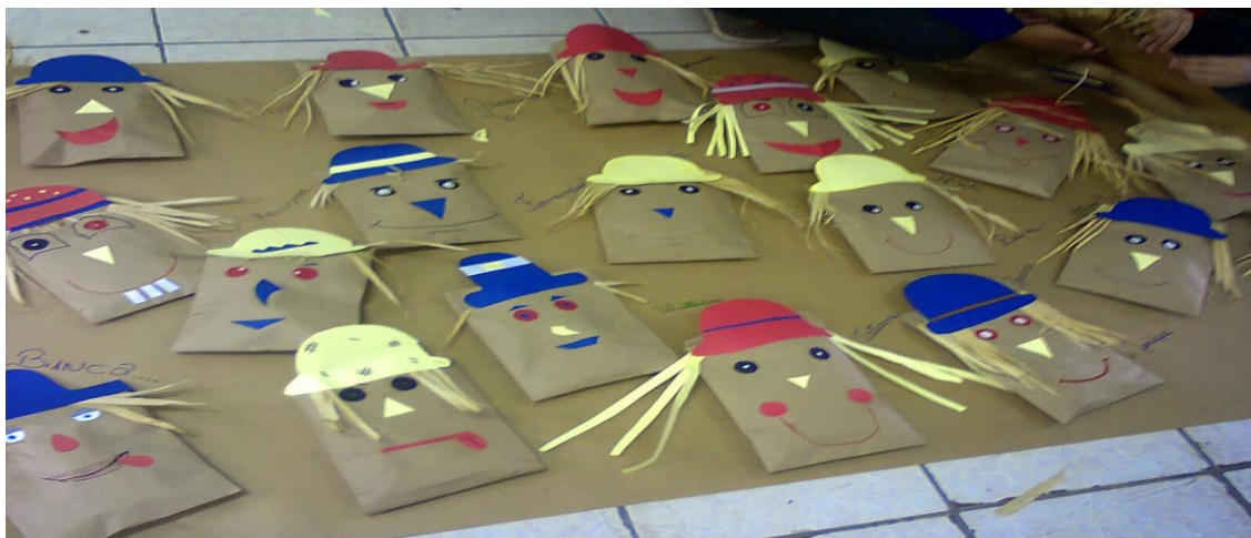
Trabalho elaborado pelos alunos da escola Theóphilo Sauer - Taquara