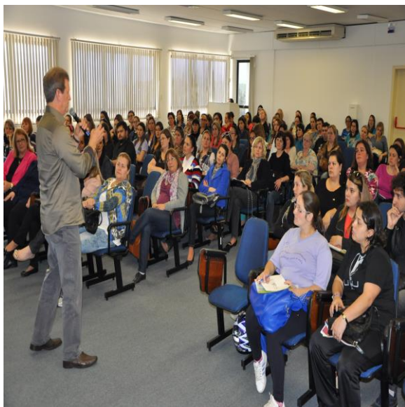
Professores participantes da 1ª oficina

A primeira oficina de 2014 do Projeto Ler, promovido pelo Grupo Sinos em parceria com as Faculdades Integradas de Taquara (Faccat) e Universidade Unisinos, ocorreu na quinta-feira, dia 22 de maio, e na sexta-feira, 30 de maio, no auditório do campus da Faccat. O encontro reuniu professores de escolas da região, que receberam o primeiro fascículo do ano, enfocando o tema “A ciência do futebol – a Copa do Mundo de 2014”.