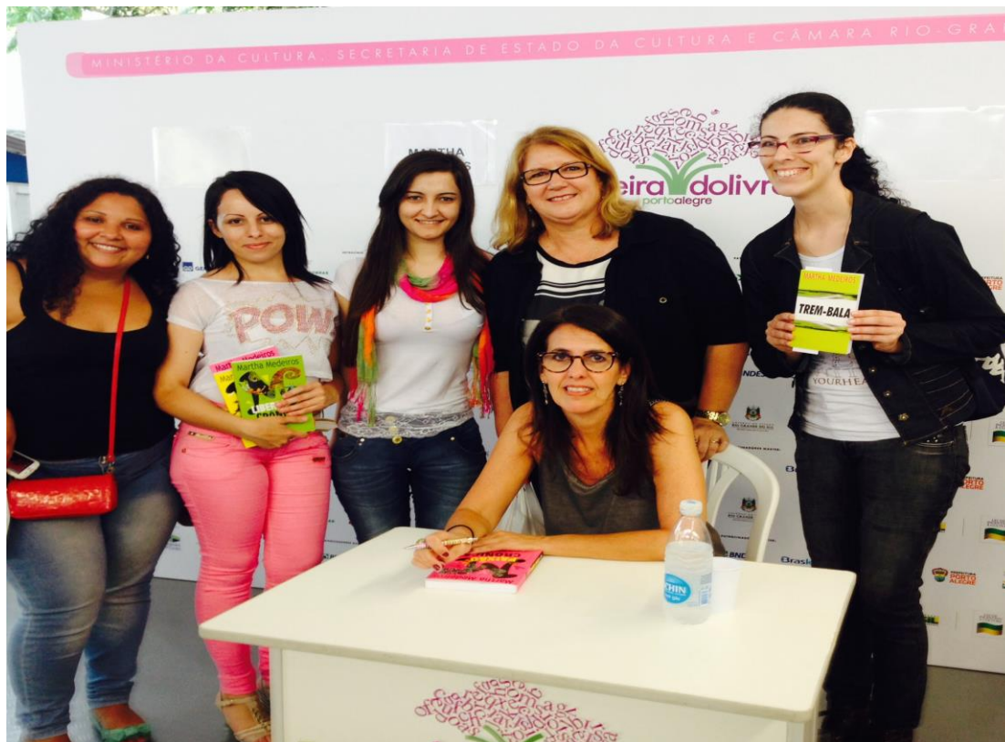
Alunos do Curso de Letras juntamente com a coordenadora do curso recebendo autógrafos da escritora Martha Medeiros

Para finalizar o passeio, às 16 horas, na sessão de autógrafos, os alunos da Faccat puderam conhecer a escritora Martha Medeiros bem como receber autógrafos em seus livros. E às 16 horas e 30 minutos todos voltaram ao ônibus para retornar à instituição de ensino.