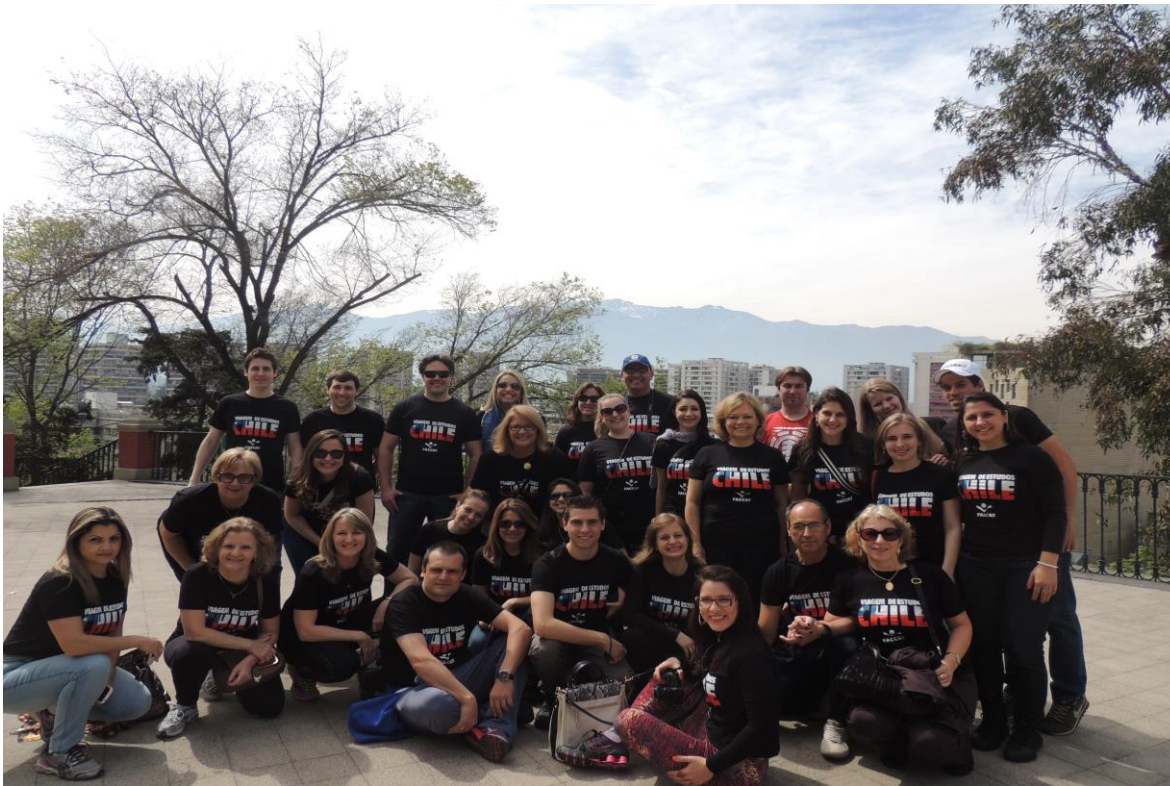
Participantes da viagem acompanhados da coordenadora de Letras e a coordenadora de Pedagogia