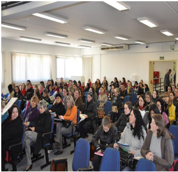
Professores participantes da 2ª oficina

E a terceira oficina ocorreu na quinta-feira, 02 de outubro, tendo como tema “Gaia, o planeta terra”.