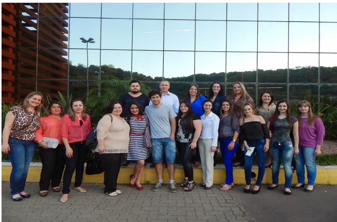
Bolsistas do Pibid de Letras e coordenadora do sub-projeto de Letras

Pibidianos no Teatro Feevale para assistir a peça “Bailei na curva”.