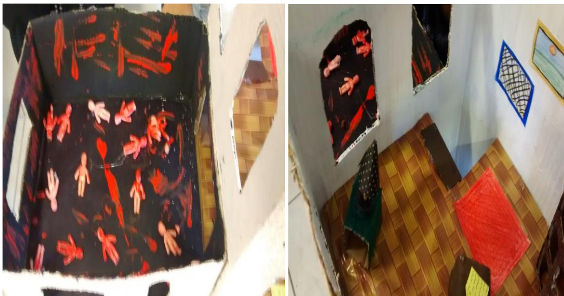
Trabalho elaborado pelos alunos da escola Felipe Marx – Taquara