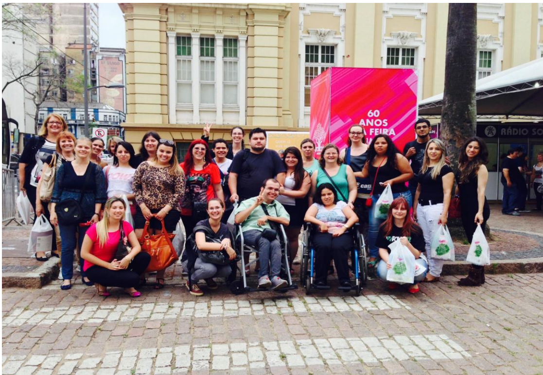
Participantes da visita técnica

Para finalizar o passeio, às 16 horas, na sessão de autógrafos, os alunos da Faccat puderam conhecer a escritora Martha Medeiros bem como receber autógrafos em seus livros. E às 16 horas e 30 minutos todos voltaram ao ônibus para retornar à instituição de ensino.