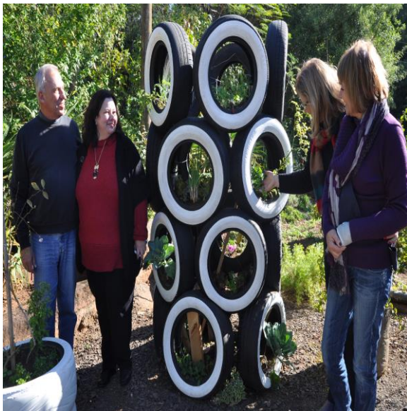
Professoras organizando o 3º fascículo em parceria com a Escola Ambiente

E a terceira oficina ocorreu na quinta-feira, 02 de outubro, tendo como tema “Gaia, o planeta terra”.