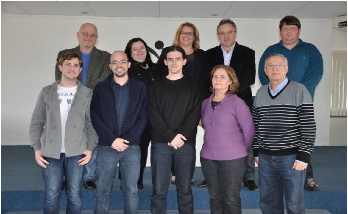
Segunda Comissão Julgadora do XIII Concurso Literário