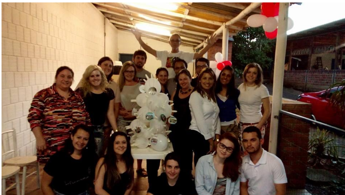
Acadêmicos e professores do Curso de Enfermagem

Descrição: A festa de Natal do Curso foi realizada no dia 03/12/14, organizada pelos representantes discentes e colegas. Contou com a participação de acadêmicos e professores, em um jantar de confraternização. Um dos alunos vestiu traje de Papai Noel e distribuiu brindes entre os presentes.