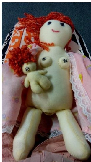
Boneca de pano utilizada para aproximar as crianças do tema amamentação e parto.