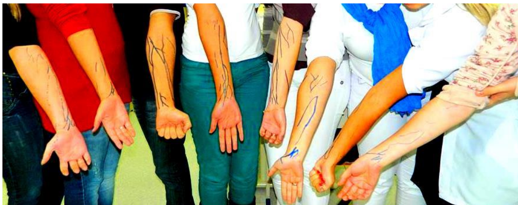
Mapeamento venoso realizado pelos participantes do evento.

Descrição: O curso destina-se a alunos da graduação que buscam conhecimento teórico-prático em relação à venopunção periférica.