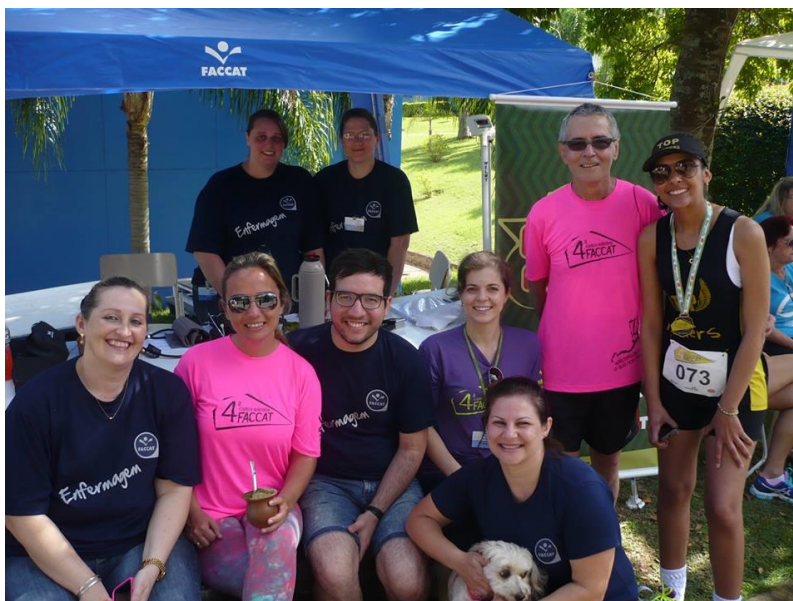
Monitores, professores e acad. De Enfermagem que participaram da Rústica.

Descrição: O Curso de Enfermagem da Faccat ofereceu à população participante, atletas e demais frequentadores do evento, a verificação de Indicadores de Saúde, quais sejam: Aferição de Pressão Arterial, medição de relação cintura e quadril e índice de massa corpórea. A fim de favorecer o vínculo, utilizou-se o Chimarrão com Saúde, cujo objetivo é convidar pessoas para uma roda de chimarrão e, aproveitando a oportunidade, tratar de um tema de interesse para a saúde.