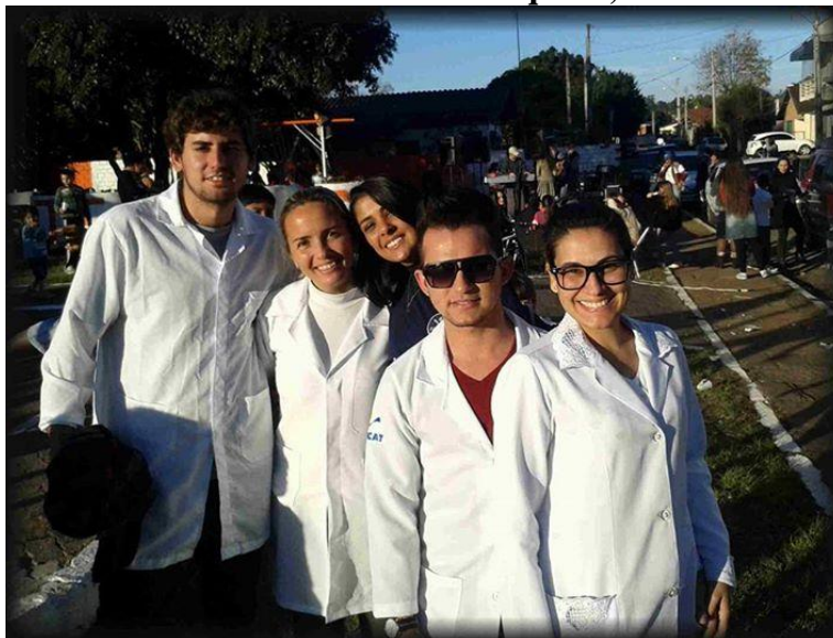
Acadêmicos de Enfermagem e professora atendem no Evento CRAS nos Bairros.

Descrição: Evento realizado no bairro Empresa pelo Serviço Social da prefeitura Municipal de Taquara, ao qual a FACCAT foi convidada a participar. No mesmo, foi oferecida a verificação de indicadores de risco de doença cardiovascular. Tal atividade é realizada pelos acadêmicos do curso, acompanhados de professor responsável.