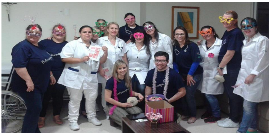
Acadêmicos de Enfermagem da disciplina “Saúde da Mulher e do Homem” realizam atividades nos diversos setores do Hospital Bom Jesus (HBJ), Taquara, RS.