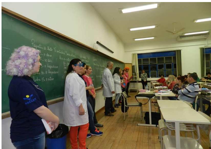
Acadêmicos de Enfermagem divulgando informações em sala de aula.

Descrição: Tradicionalmente, o mês de outubro é caracterizado por ações promotoras da reflexão acerca do câncer de mama. Atividades inerentes à prevenção do câncer de mama são realizadas internacionalmente. Para chamar a atenção para a causa, o Curso de Enfermagem, a partir da disciplina “Saúde da Mulher e do Homem”, promoveu ação de divulgação de informações nas salas de aula do campus da Faccat.