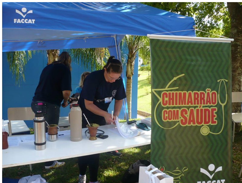
Estande da Enfermagem, com a proposta Chimarrão com Saúde.