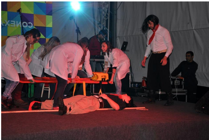
Acadêmicos de Enfermagem simulam imobilização de vítima no palco central do Conexão.