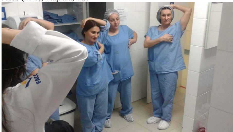
Profissionais do Bloco cirúrgico realizam auto-exame de mamas, conforme orientação dos Acadêmicos de Enfermagem